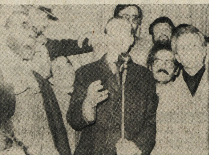
Generalni sekretar OZN Kurt Waldheim govori pred mikrofonom v revolucionarnem Iranu (zgora). Pred prejšnjim obiskom v Teheranu pa je kot pristni dunajski kavalir poljubljil roko šahovi polsestri Asraf (spodaj).