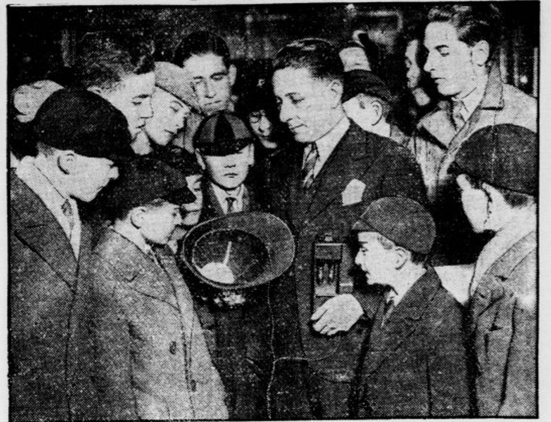
Angleški detektiv razlaga srednješolcem skrivnost radia v klobuku