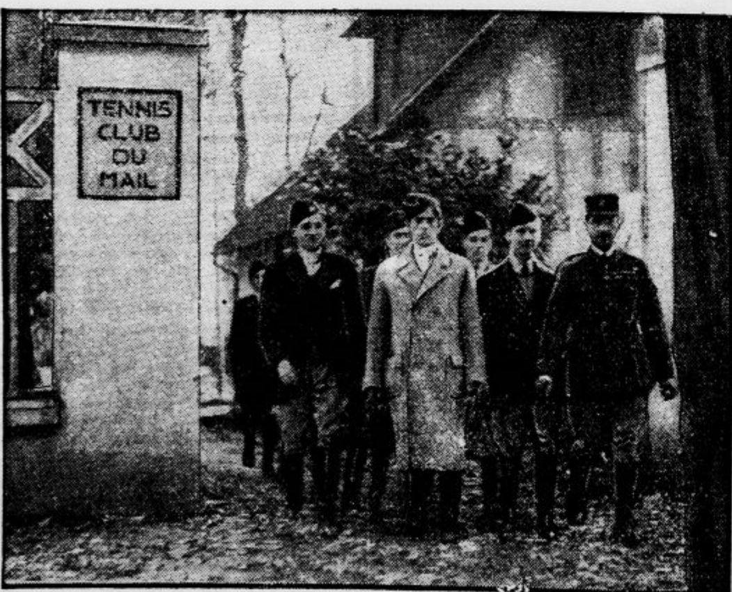
To sliko objavljajo Nemci kot dokazni material za »militarizacijo« francoske mladine. Člani tega teniškega kluba so zagrešili samo to, da jih podučuje v elegantnem sportu — vojaški rezervist