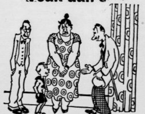
— Po mami sem ti ujec. — Ah, če bi poznal mamino, bi mi bil rajši stric po očetu.