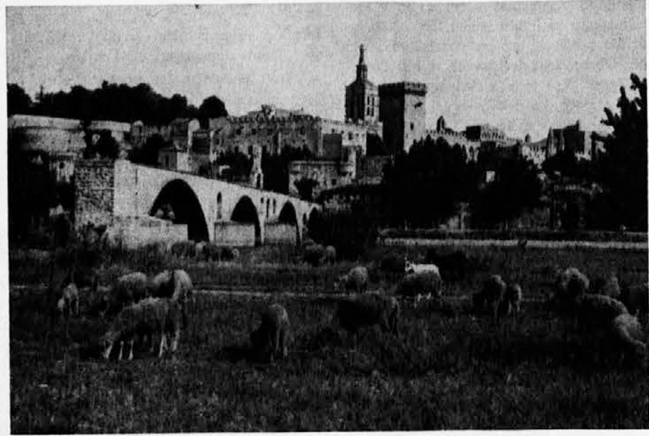
Pogled na Avignon z Rodana mimo mostu Saint-Bénézet