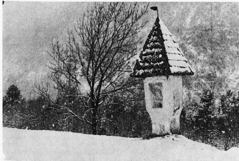
Poljsko znamenje v Dipalji vasi (S. Leopoldo) v Kanalski dolini

Slovenski pregovor: »Z Bogom začni vsako delo, pa bo dober tek imelo«, vsebuje globoko življenjsko modrost. Zato želimo, da bi v novem letu doživeli njegovo resničnost vsi bralci, sodelavci in podporniki našega lista, pa tudi vsi drugi rojaki, ki so dobre volje. Poleg božjega blagoslova želimo vsem obilo zdravja, dušnega in telesnega, pa resničen mir v smislu gesla, ki ga je izbral za letošnji Dan miru 1. januarja papež Pavel VI.: »Nočemo nasilja, hočemo mir!« Nočemo ideološkega, političnega in roparskega nasilja, nočemo nasilja v obliki oboroženih spopadov, nočemo nasilja nad nerojenimi bitji, temveč mir s seboj, z bližnjim in Bogom, mir v naših družinah in sosedstvom, sožitje v družbi. Skupno jih pomagajmo udejestviti! To so naše želje za leto 1978!