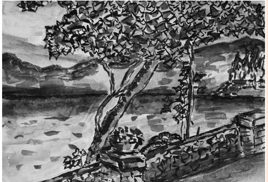
Zdenka Kallan Verbanac