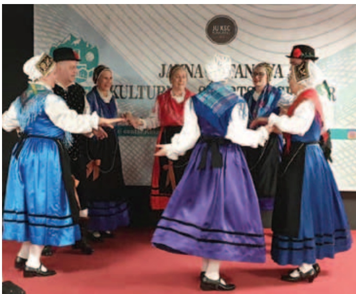
Z nastopa na enem izmed gostovanj