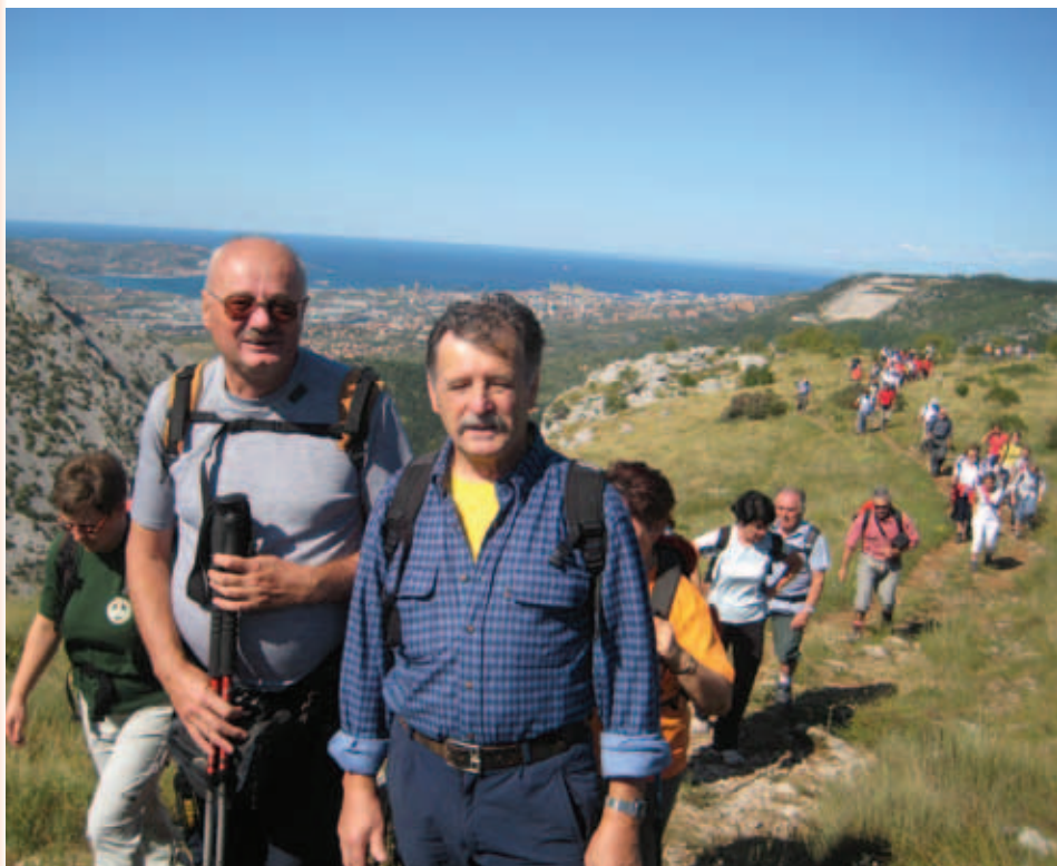
Z enega od izletov, foto: Maruška Lenarčič

Za dežjem pride sonce – vedno. Zdaj imamo sonca v izobilju, za čakamo na tisto pravo, po koroni, ko se bomo spet družili, skupaj hodili po poteh v sijoči, na novo ozeleneli naravi.