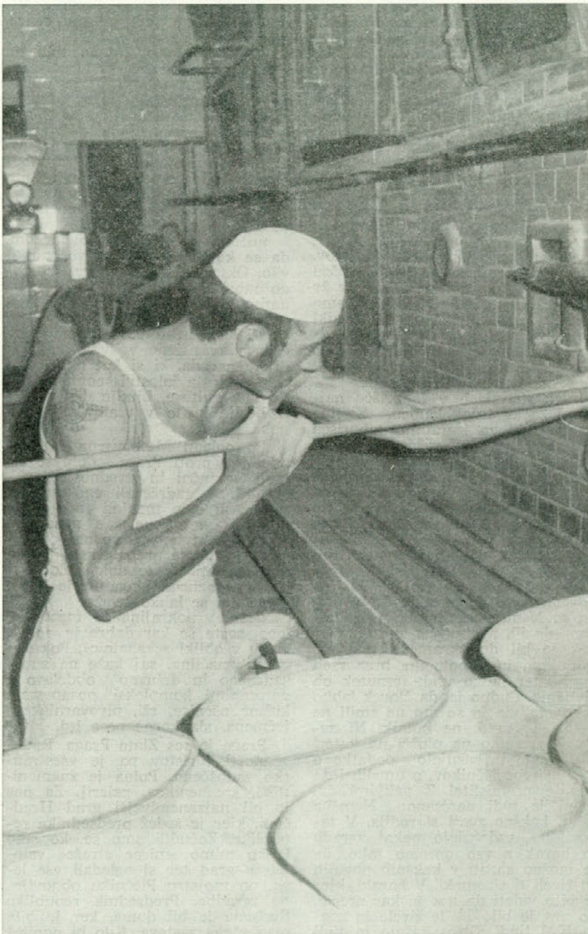
V katerokoli pekarno pogledaš, povsod ista slika — povsod upognjeni hrbti in potna čela