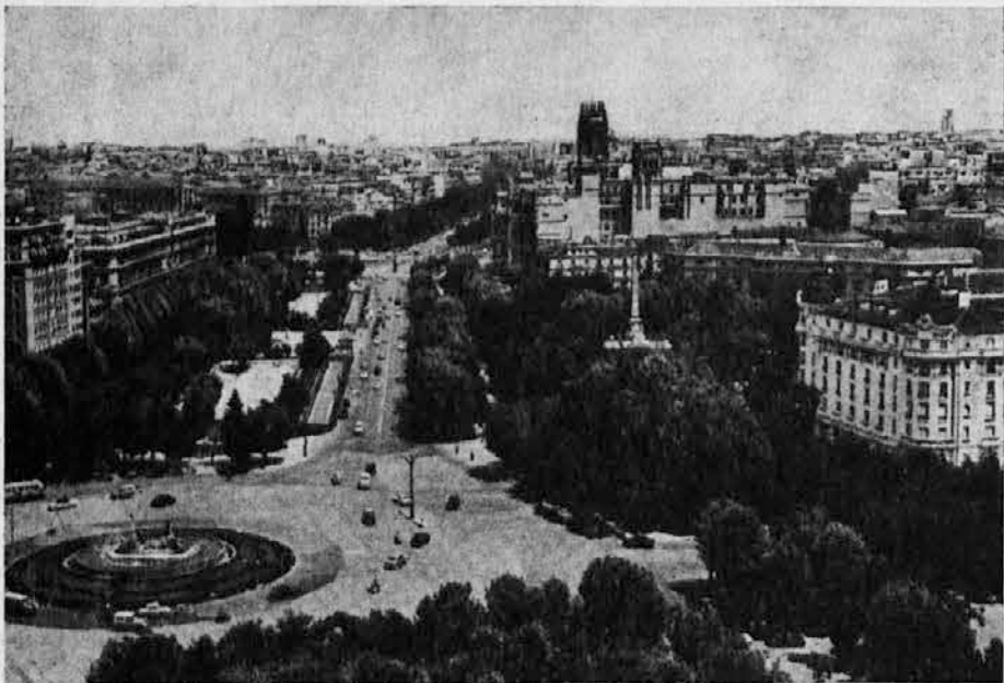
Glavno mesto Spanije Madrid je najviše ležeča prestolnica v Evropi, saj leži na kastiljski planoti 650 m nad morjem. Je še relativno mlado mesto, staro komaj 400 let. Prej je bila prestolnica Spanije Toledo. Je izredno lepo, snažno in prostrano mesto. Značilen izraz mu dajejo široke avenije, ki prečkajo mesto na vse strani. V zadnjem času je zaznamoval Madrid izreden porast na prebivalstvu. Danes šteje 3.500.000 duš in je na desetem mestu po številu ljudi med največjimi mesti na svetu.

Svet je z večino glasov izrazil svojo zaškrbljenost za posledice, ki bi jih utegnili imeti za slovensko manjšino in za kulturno sodelovanje med njo in matičnim narodom kazenski proces, ki je bil napovedan v Ljubljani proti souredniku tržaške revije »Most«.