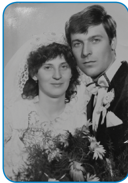
Zdavanjski kejp je redo fotograf Tanay

»Dja sem že potistim na- zajüšla delat v nyakkendő, da sem sina rodila, zato ka