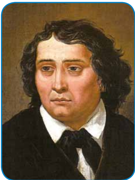
Pesnik France Prešeren se je naraudo 3. decembra 1800 - na té den (»ta veselí dan kulture«) majo šegau na Slovenskom dosta kulturni programov držati

Prešeren je največ piso o svojoj lübezni do žensek in domovine. Njegvo čütenje do lepšoga spola je mejlo dosta obrazov: od tujoga vüpanja