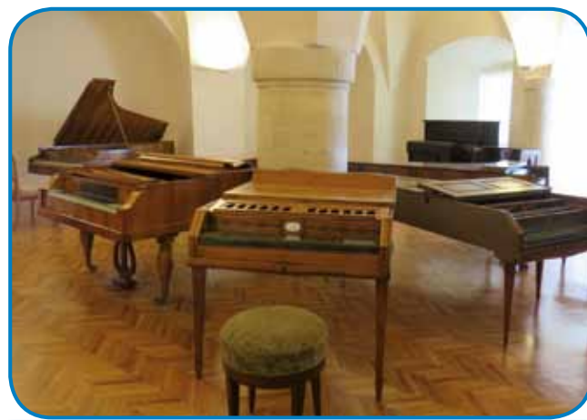
Glasbila s tipkami

različna glasbila od 17. stoletja naprej, ki spadajo v skupino godal, brenkal in pihal. Ta soba nosi tipičen naslov »Pretanjeni zveni komorne glasbe - živahnost muziciranja v kasnejših letih uspešnih violinistov. Z zagnanostjo in ljubeznijo je v čudoviti svet glasbe uvedel tudi svoje štiri hčere, po njegovi glasbeni poti pa stopajo tudi njegovi