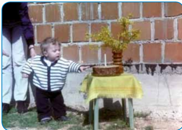
Živé svoje senje stran 8