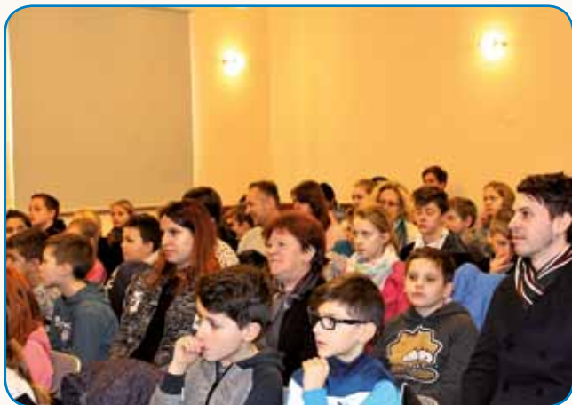
60 let Društva Bralna značka Slovenije stran 3