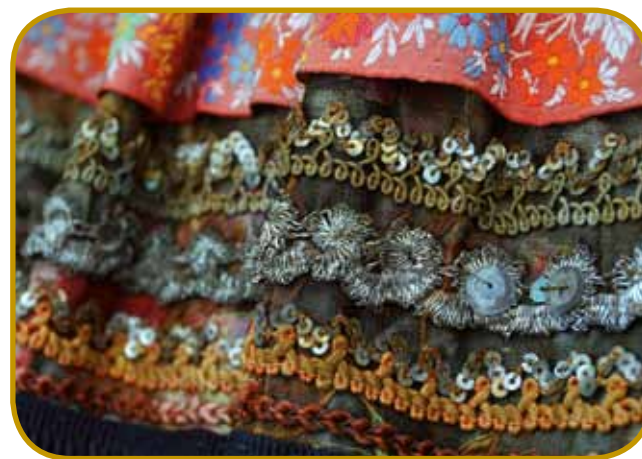
Ženske v krajini Sárköz so nad trejmi tridimi spaudnjimi kiklami nosile židane kikle - bile so najbolje bogato okinčane na Vogrskom

Če pa je nekak najgir na dve najbole strašni bojni človeče zgodovine, leko s pomočjav tedešnji predmetov spozna pripovejst prve in drüge svetovne bojne v muzeji »Baka«. Eričen rojak Szekszárda je biu madžarski pesnik Mihály Babits, v njegvoj rodnoj iži leko vidimo originalno poištvo, listamo fotoalbum držine ali štemo rokopis poeta. Če nam ne dojde, ka Babitsa vidimo na filmi, si na dvoriški leko poglednemo njegvi kip. V nekdešnjoj törskoj kaupanci so oprli Muzej vina, šteri nutpokaže inčašnje in gnešnje pauvanje grauzdja. Nej daleč, v Muzeji medenjakov, pa leko spoznamo majsterske tehniké pečenja in formiranja medeni figic. Največšiva programa v Szekszárdi sta v cajti bratve in za risauske svetke. Na ta srečanja gnesneden že na léki pridejo lidgé z ov kraj Donave tö, vej so pa söverno od varaša leta 2003 prejka-