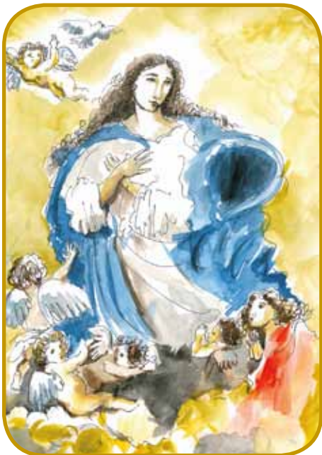
Blajžena Devica Marija je edina od vsej lidi, štera je pri poprijetji nej bila grejšna, liki »milosti puna«

Mrau je leta 397, njegvi kejp nam je gorausto na ednom mozaiki, šteri je gnes v milanskoj baziliki. Ta cerkev je posvečena svetoma Ambroži, ki je pokopani pod glavnim oltarom. Za patronuša ga držijo fčelarge, zatok ga dostakrat namalajo s košom za fčele.