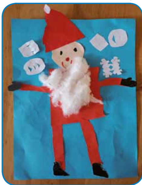
Lara Barabás, 6 let, vrtec Monošter