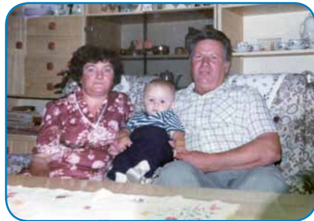
Tast pa tašča z vnukom

paut delati začnila, te so gu- čali od tauga, ka tau fabriko zaprejo, tak sem te dja prej v fabriko Sariana odišla. Trinajset lejt se tam delala, te so tau tö zaprli, dja sem pa üšla na Rábafüzes delat, v čistilnico, ta, gde gvant pe- rejo. Sedem lejt sem delala v pralnici, pa te sem v fab- riko Vossen odišla, gde še gnesden delam. Vü pam, ka zdaj že ostanem dočas, ka v penzijo ne odidem, zato ka pa drügo leto mam že samo nazaj.«