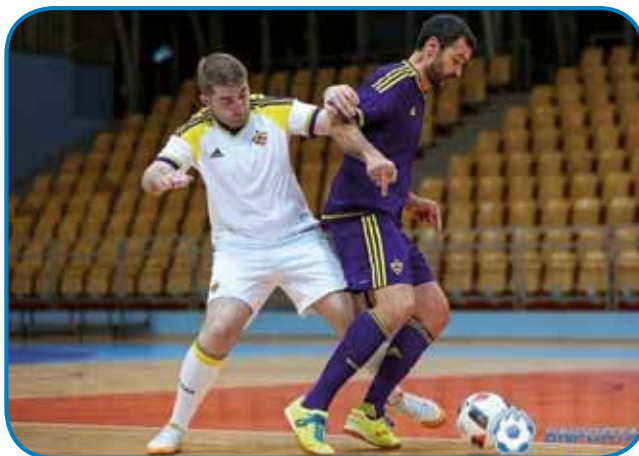
Čiglij pravi, ka labde glij ne vej preveč dobro brsati, tū pa tam tudi sam odšpila kakšno pajdaško fotbalsko tekmo

ka smo dokazali, ka se da tudi s takšim prostovoljnim, neplačanim delom nekša stvar dobro napraviti.« In iz toga prostovoljnoga dela je pred par lejtj prišlo do re-