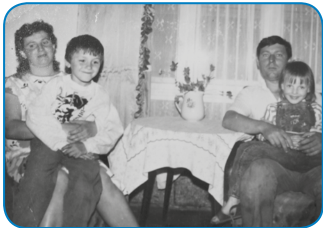
Mlada zakonca s sinaum pa hčerko

pa tašča sta rano mrla ram je pa prazen austo. Te smo si