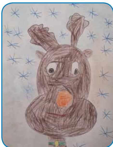
Gergő Horvath, 6 let, vrtec Monošter