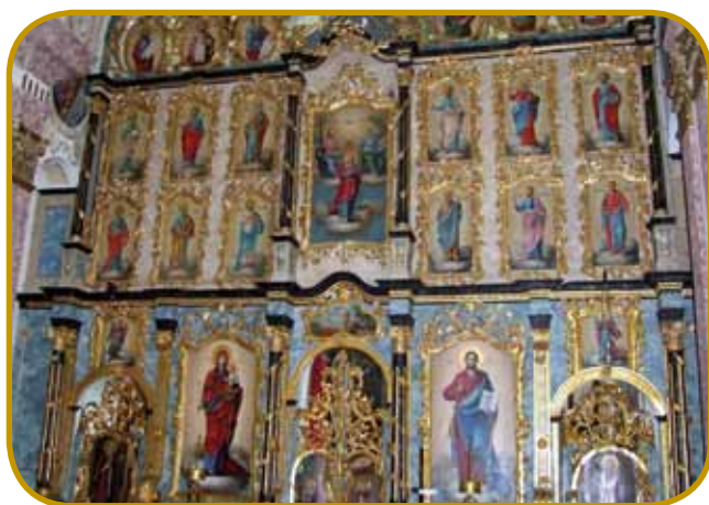
Spaudnji tau »ikonostasa« v Grábóci - svetniki so v več redaj, vsikši má svojo naprejšpisano mesto

tistec pa nas vsikši den pela mali cug v poplavne gaušče (ártéri erdök). Če smo zavolé batrivni, organizérajó za nas ture s kenunami ranč tak. Depa drüge zanimivosti tö skriva krajina: v vesnici Báta je edino prauškarsko mesto »svete Krvi« na Vogrskom, vés Bogyiszló pa je erična po svojom krepkom,