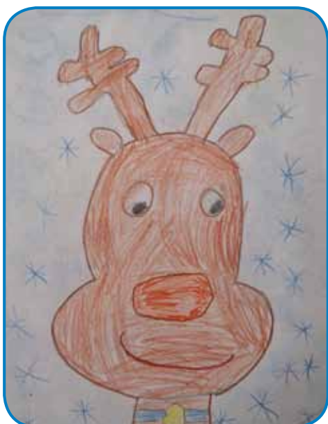
Mirkó Kozó, 6 let, vrtec Monošter