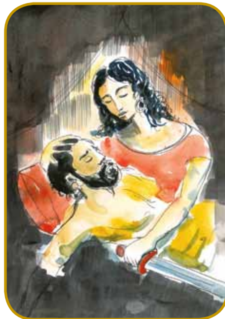
Judita je Holofernesa zacumprala s svojov lepotov in ma pidjanoma odsekla glavau - potistom so neprijateli Židauvov zbejžali

držimo njeni den 10. decembra. Hebrejsko ime »Juhudit« znamenüje »Židauvkinja«, Madžari go poznajo kak Judit, Nemci kak Jutta, Angleži kak Judy ino Francuzi kak Judith.