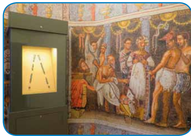
Rimska dvojna piščal-tibia

nja v plemiškem, meščanskem in cerkvenem okolju. Med razstavljenimi glasbili so tudi takšna, ki so jih izdelali priznani izdelovalci. Do danes pa se je ohranila le peščica njihovih glasbil kot na primer: