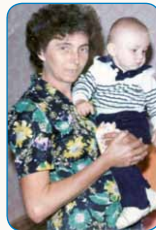
Ka je dano, je dano stran 4