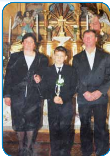
Z vnukom pri prvöj spauvedi

- Kama si üšla delat potis- tim, ka si zgotauvila?