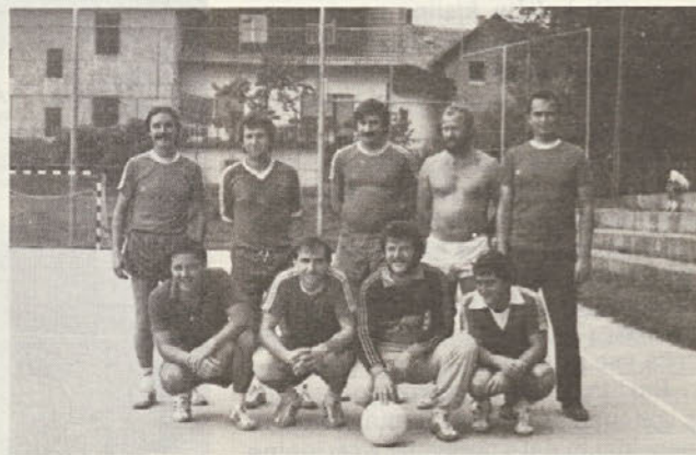
»Sotrpini« – drugo moštvo prvenstva