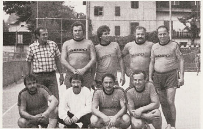
Moštvo Kemije Šempeter