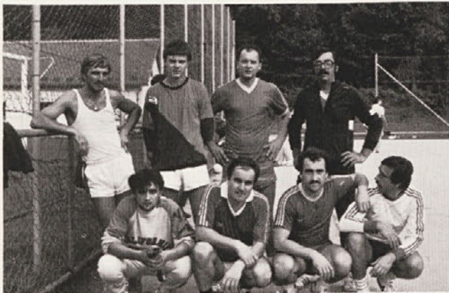
Moštvo iz AC