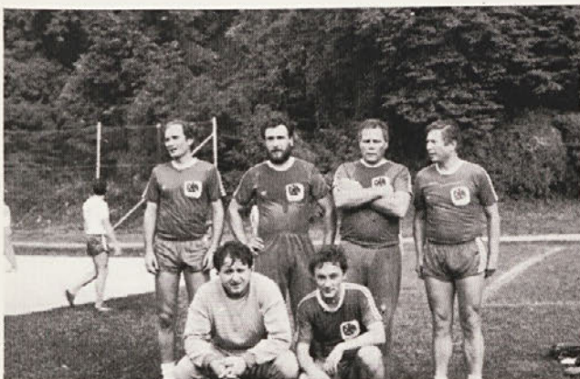
Moštvo iz Reprodukije