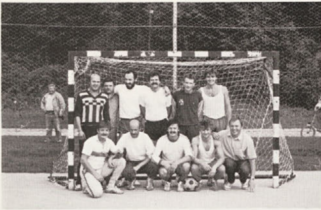
Moštvo Olseta – tretjeuvrščena ekipa