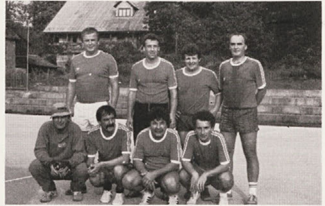
Tehnologi iz Grafike