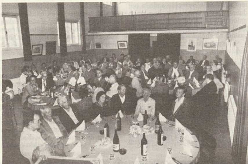
Srečanje upokoјencev v Sori 29. 9. 1988