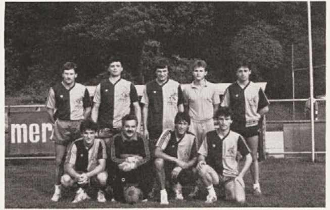
Moštvo Vzdrževanja iz Kemije Celje