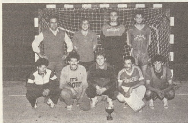
Zmagovalci internega prvenstva Aera '88 – moštvo NO