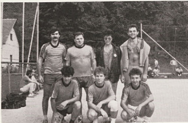
Moštvo Vzdrževanja iz Grafike