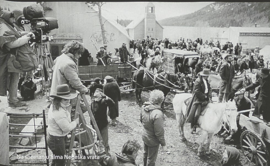
Na snemanju filma Nebeška vrata

morajo tudi slovanski emigranti v Nebeških vratih plačati zelo visoko ceno za integracijo v obljubljeni dežel. Amerika jih namreč noče. Zgodbice o deželi enakih možnosti, kjer ima vsakdo priložnost, o pionirskem duhu, talilnem loncu, demokraciji in pravici za vse, za njih ne veljajo. »Vrnite se tja, od koder ste prišli,« vpije Christopher Walken na kolone bednih, umazanih, razcapanih, ponižanih in lačnih priseljencev, ki trumoma prihajajo. Da bi preživeli, so bogatim veleposestnikom prisiljeni krasti živino. Zato jim privilegirani razred bogatašev, povezan s politiko, sodstvom in vojsko, napove vojno in sestavi »listo smrti«, seznam 125 imen, ki jih je treba iztrebiti. Brezpravna raja se upre in že smo sredi razrednega boja med tistimi, ki imajo vse, in onimi, ki nimajo ničesar, med elito in proletariatom, med kapitalizmom in socializmom. Osamljeni kavboj, ki v običajnem vesternu prijezdi v mesto in naredi red, tu nima kaj početi. Jim Averill (Kris Kristofferson) lahko le nemočno opazuje brutalno uveljavljanje brezobzirne logike kapitalizma. Zveni znano? Ja, film je danes bolj aktualen kot kadarkoli.