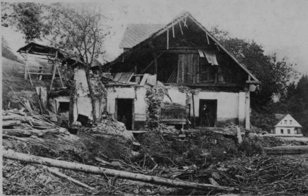
Gostilna pri Mostarju blizu Sovodna. Voda Sovodenšica je odnesla hišo; ostal je samo hlev, ki je bil pod isto streho kot hiša.