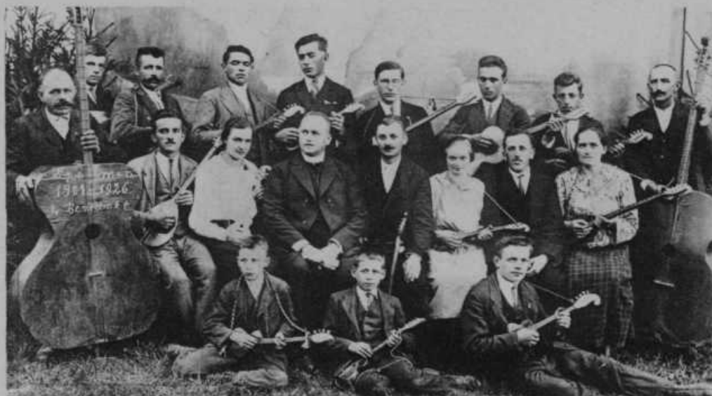
25 letnica tamburaškega zбора pri Sv. Benediktu v Slov. goricah (Štajersko) dne 5. septembra 1926.

Predoseljska župnija leži na ravnini med Storžer Jožefa II. leta 1787. Župno cerkev je nadomestil Ksist Zois z Brda. Kapela je bila posvečena v pa je kljub hudim časom, ki so bili tedaj, začel misliti župljanov je svoj načrt izvršil, dasi sam ni dočel. Letošnjo kvatarno nedeljo se je stoletnica te zelo cerkve obhajala z veliko slovesnostjo. Gornja slika ki je bila to pot nad vse okusno, te