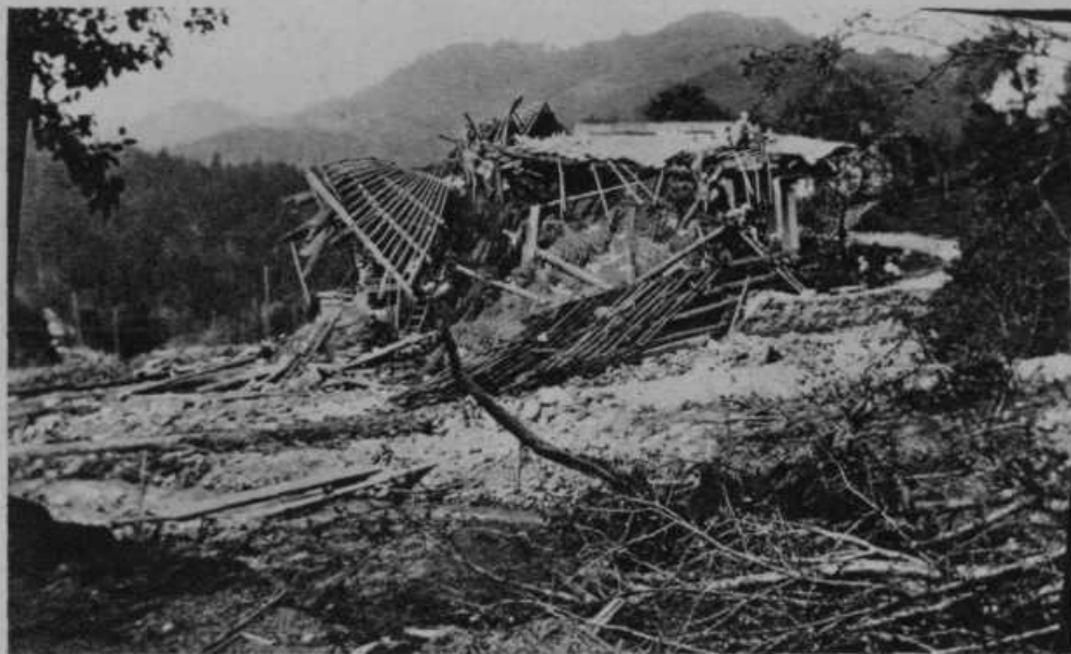
Kafurjeva razvalina v Selu pri Žireh po povodnji 27. septembra.

Predoseljska župnija leži na ravnini med Storžer Jožefa II. leta 1787. Župno cerkev je nadomestil Ksist Zois z Brda. Kapela je bila posvečena v pa je kljub hudim časom, ki so bili tedaj, začel misliti župljanov je svoj načrt izvršil, dasi sam ni dočel. Letošnjo kvatarno nedeljo se je stoletnica te zelo cerkve obhajala z veliko slovesnostjo. Gornja slika ki je bila to pot nad vse okusno, te