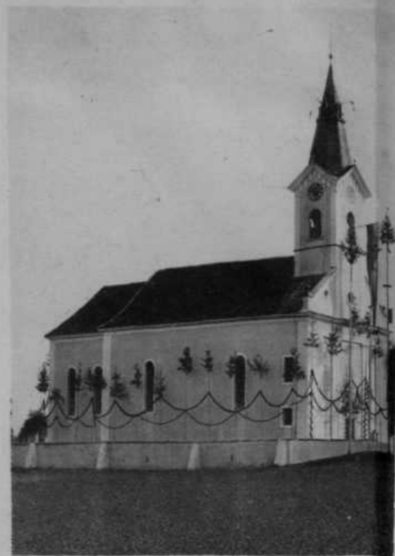
Ob stoletnici župne cerkve