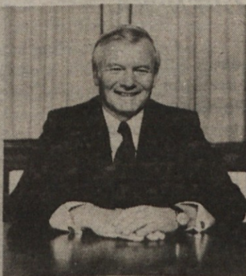
Hon. William G. Davis Predsednik ontarijske vlade