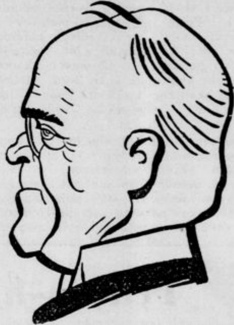
sestavil jo je Albert Sarraut ter ima značaj meščanske koncentracije