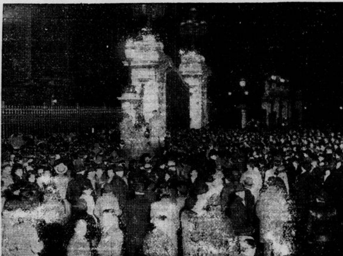
Množica ljudstva rine k ograji, da bi prečitala vest o vladarjevi smrti