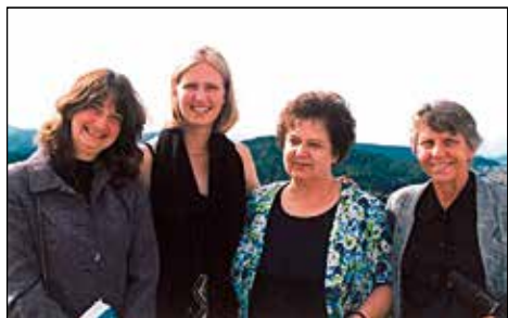
Skupina, ki je raziskovala menopavzo in menopavzalne simptome pri ženah v Selški dolini. Antropologinja, profesorica z Univerze Amherst v Massachusettsu, ZDA, in avtorica prispevka.

Anglije, Avstralije in različnih delov Amerike. Tako smo že vrsto let zelo aktivno in uspešno vključeni v mednarodna sodelovanja.