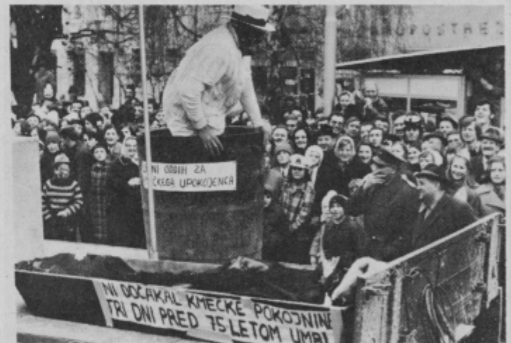
„Kmečko veselje“ s Hajndla pri Veliki Nedelji