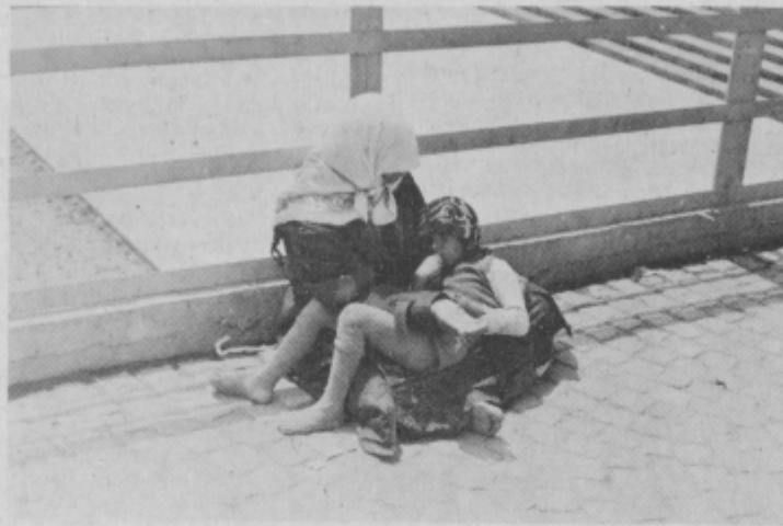
Kako različni so kraji. Ljudje, navade; vendar je povsod nekaj skupnega, enakega. Nekaj je, čemur pri nas pravimo MATERINSTVO.

Naša nova slovenska ustava je sedaj stvarnost. Sedaj nas čaka obsežno delo, da bomo to ustavo tudi realizirali. Z njo smo sprejeli namreč tudi nove obveznosti, pa tudi nove odgovornosti.