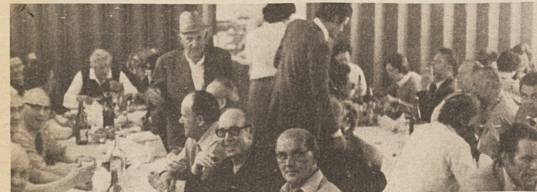
Tovariško srečanje upokojencev in delavcev delovne organizacije Emona blagovni center v prostorih družbene prehrane na Šmartinski cesti 102