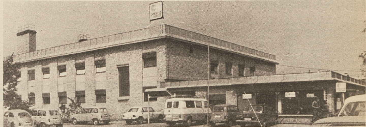
Stavba pekarnice Pekarne center ob Tržaški cesti v Ljubljani

Smo že v polnem razmahu sezone in vemo, da bo mnogo problemov zaradi prenapoljenosti hotelov, zato moramo še posebno paziti na dobro izvedbo nalog v zadovoljstvo naših poslovnih partnerjev in gostov. Če bi prišlo do večjih problemov se takoj obrnite na pristojne službe na upravi in zahtevajte ustrezno pomoč.