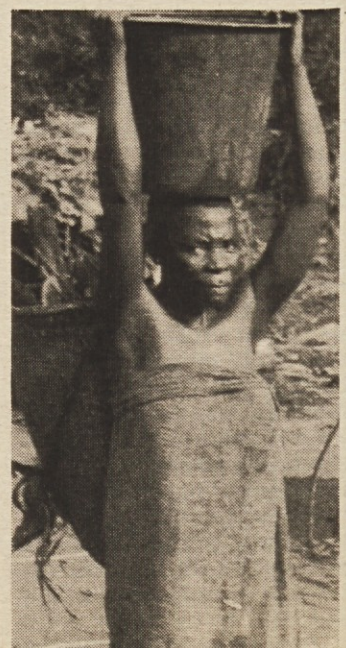
Pigmejka – obiralka kave