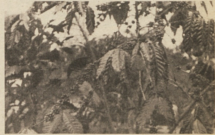
Kavovec na naši plantaži v Lidjombu, ki bo dozorel decembra