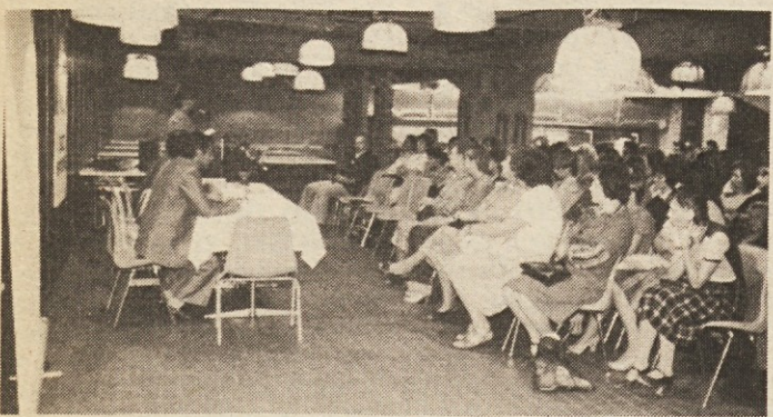
S sprejema novih učencev