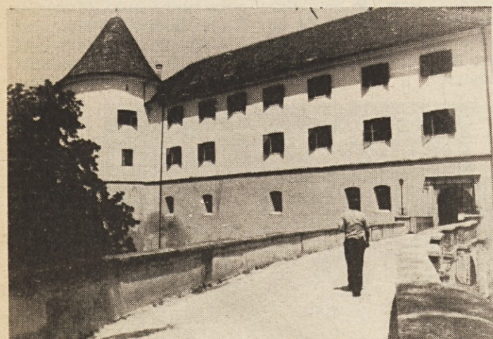
Pogled na prenovljeni grad mokriški, cilj prenekaterih domačega in tujega gosta

koli. Če ne verjamete, sami stopite pog zanesite mimo, saj so Mokrice samo dobre tri kilometre oddaljene od Čateških toplic ali 25 od Zagreba in jih z avtomobilske ceste zlahka opazite. Je potemtakem kaj čudnega, če je celo zagrebške televizijske delavce zamikalo, da so si s kamerami »ogledali« eno mokriških ohceti? IN: cviček ter bizeljčan,