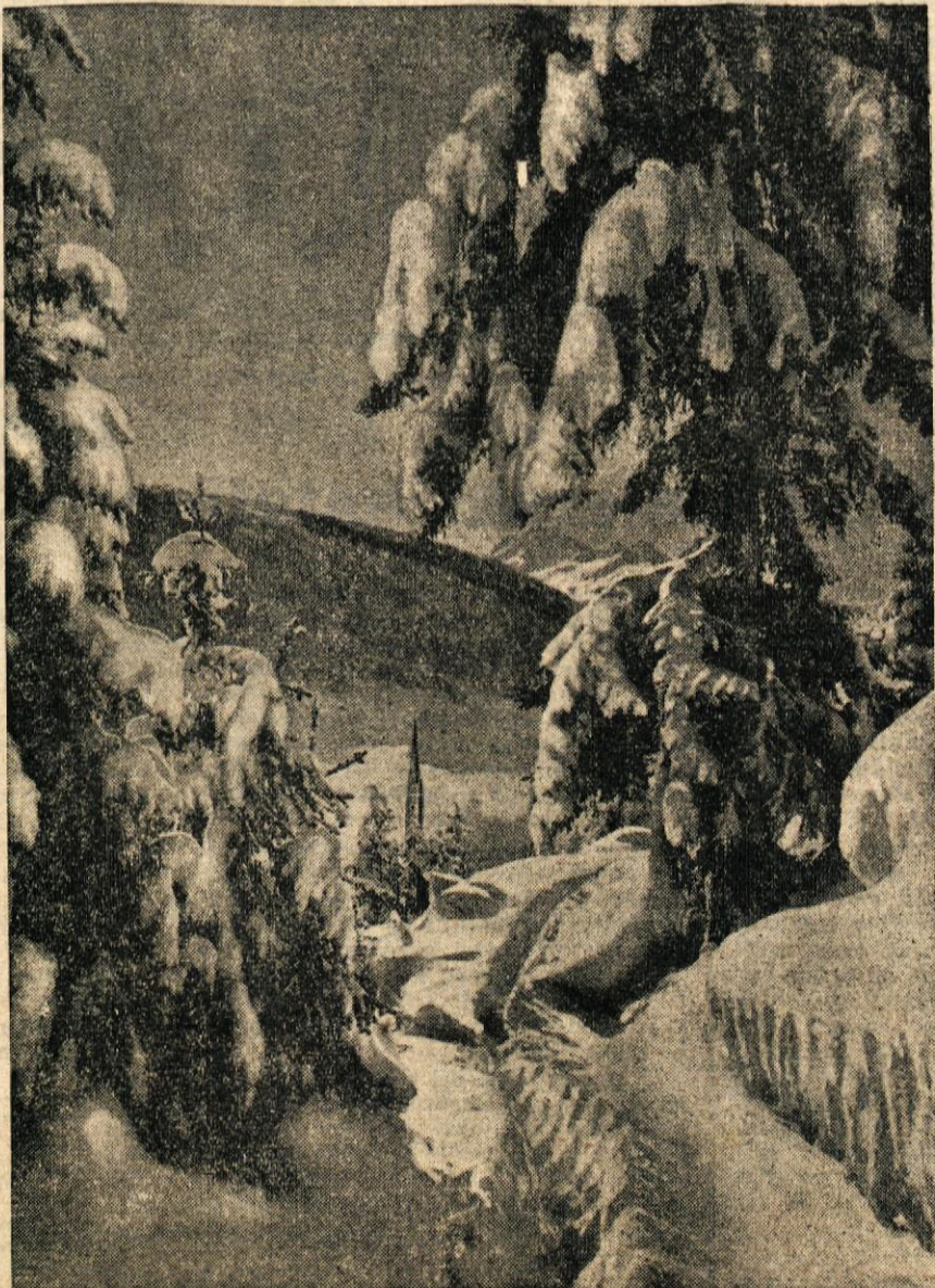
Dolenjski grič in holti so pokriti z belo odejo. Vlak si je komaj utri pot iz Ljubljane. Sneg povzroča mnogo nevesnosti, posebno otrokom pa tudi mnogo veselja.

V nedeljo 27. januarja so imeli združniki na Trški gori redni letni občni zbor, katerega so sami imenovali »naš največji praznik«. Uspeh njihovih delovnih danov v lanskem letu je najbolj razviden iz čistega dohodka in višine zaslužka delovnega dne: 230 din za vsak delovni dan. O naporih, razvoju in uspehih kmečke delovne zadruge na Trški gori bomo obširneje poročali prihodnjč.