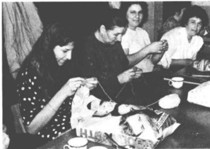
Poleg strehe nad glavo, materialne pomoči so za begunke(ce) v novem okolju pomembne tudi ustvarjalne dejavnosti. Z njimi naj bi jih spodbujali k različnim oblikam samoorganiziranja, samopomoči, izobraževanju,...