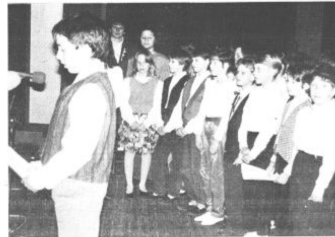
Prisrčni nastop šolarjev je pozdravila prepolna dvorana