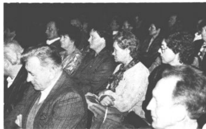
323 članov Kmetijske zadruge Šaleška dolina je lani doseglo (kljub suši) spodbudne proizvodne rezultate. Ti se žal, niso odrazili v tolikšni meri tudi pri finančnih