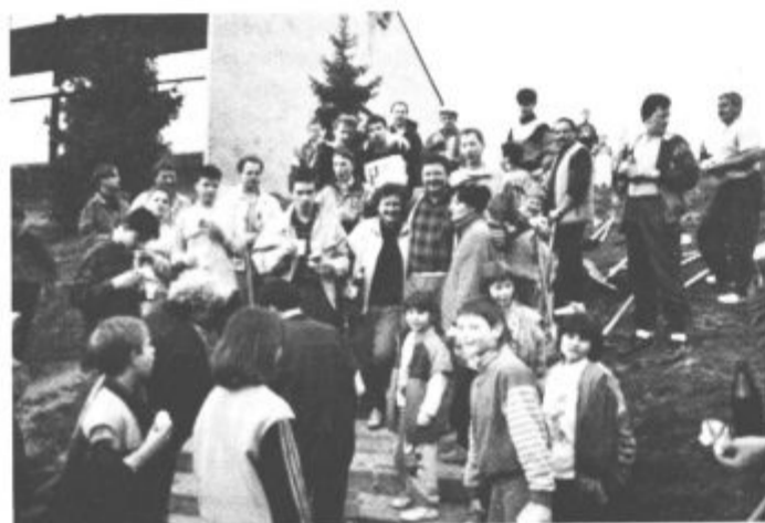
Pisana družina "udarnikov" po opravljenem delu pred šolo Bratov Mravljakov