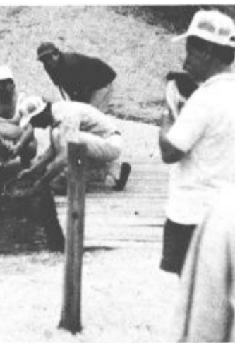
Zlatosledci iz Šaleške doline

Ko so leta 1851 v Avstraliji odkrili zlato, se je razpoloženje in