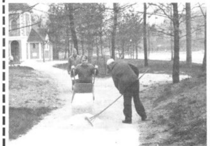
Nekaj desetnih krajanov Mozirja je bilo v zadnjem obdobju zares pridnih