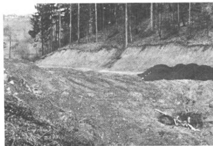
V Kavčah in Podkraju pridno gradijo otroška igrišča