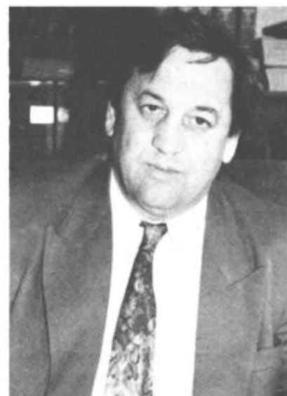
"Projekt bo zaključen, ko bodo vsi delavci, ki so danes še brez dela, to tudi dobili."