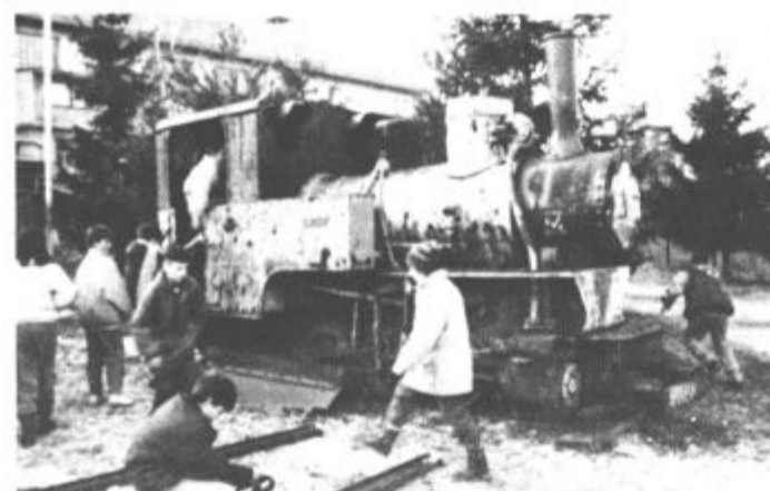
Lokomotiva pa še naprej rjavi

Lokomotivo so pred leti odstranili z igrišča, češ da je za otroško igranje