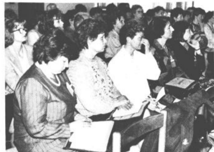
Okolje in šola danes na mlade delujeta preveč stresogeno, so poudarili udeleženci strokovnega srečanja