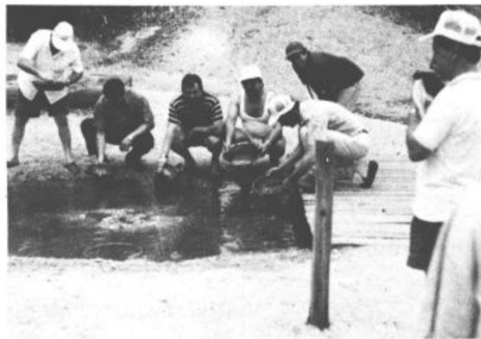
Zlatosledci iz Šaleške doline

nejšem delu motela pa so se še dolgo v noč vršile debate, odmeval je smeh in vesela pesem, vmes pa so se mešali značilni zvoki odpiranja pivskih pločevink. V najbolj oddaljeni sobi je prebival eden naših basistov. Ko je že povsod vladala tišina, so iz te sobe