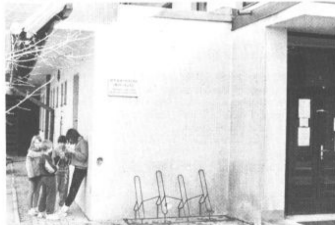
Nadzidek naj bi zgradili nad obstoječimi delovnimi prostori KS Šmartno ob Paki