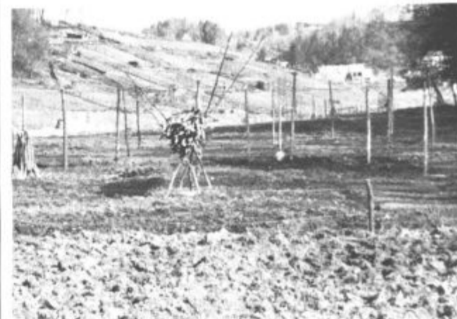
Divje vrčkarstvo si utira pot proti Bevčam