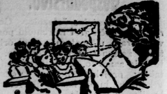
Nova stekla za daleč in bližino, važno za dalekovidne.