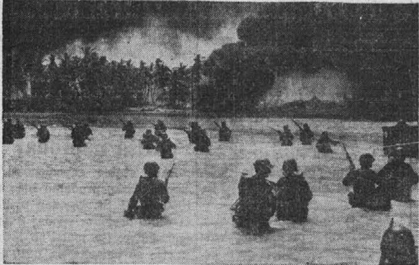
Slika jasno kaže plamene, ki so jih povzročili napadi od strani ameriških mornariških čet 165. infanterije. Moštvo je brodilo po vodi, da je dospelo na Makin otok. Invazijo Makina se je izvedlo z veliko manjšimi izgubami življenja kot pa je zahtevala kampanja Tarawa.

"Kadar te spet pokliče Mina, vzemi še mene s seboj." Kljub zbadljivemu naglasu se nisimo mogli smejeti. Dahnilo je nekaj tajinstvenega, nekaj zagonetnega k nam. Iz dima in saj so se izmotali domači kraji, tople kmečke sobe, kjer pri jaselcah drhtita oče in mati za sina, kjer žena objokuje moža in sklepajo otroci v ljubeči bojazni drobne roke v želji, da bi se vrnil oče, ki ga komaj še poznajo po obrazu. Tudi četovodja Klinar je obmolnil in si kakor v utrujenosti podprl glavo z dlanmi: "Oh, ne, ne, ne, oh, naj ostaneva!" je nenadoma zaprosila božična pesem in napolnila ves zaklon z nepojmljivo nežnostjo. Sveče na boru so dogorevale in sence so begale po obrazih kakor usodne roke zagonetnih pošasti. "Teja ne bi bili smeli peti," se je zdrznil Klinar. "Presveto in pretoplo je za ta kraj —" "Pa poplakni!" mu je ponudil Bojo zelenko. "Kar pošteno nagni, da boš bolj živo videl svojo Mino!" "Fant!" stisne zdajci Klinar pest in zaškriplje z zobmi, toda tovariši pomirijo pretečo roko, da se res oklene zelenke in jo nastavi na usta. Potlej zamre beseda in smeh utihne. Klinar buli predse in molči. Nekje se vzdrami rohne-