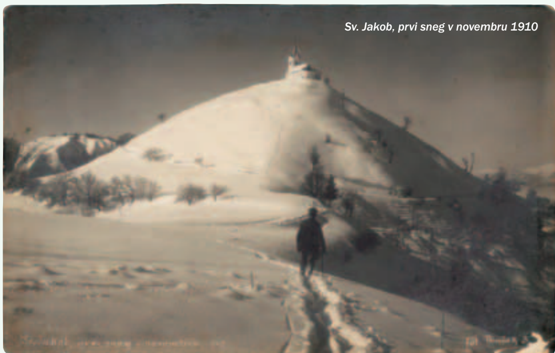
Sv. Jakob, prvi снег v novembru 1910