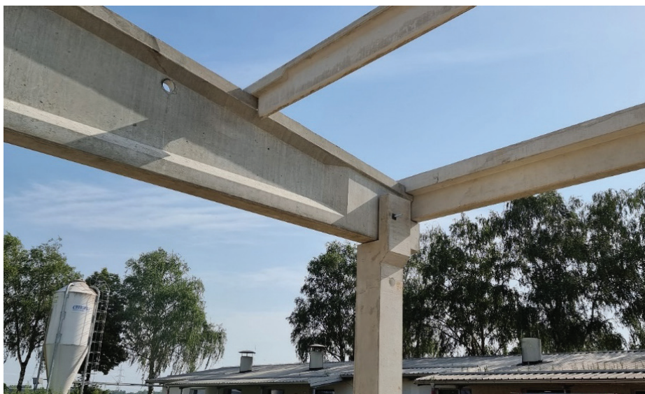
Slika 7. Naleganje robnega in sekundarnega nosilca na primarni dvokapni nosilec. Primarni nosilec nalega na steber.

Novozgrajeni objekt površine približno 4500 m 2 bo namenjen za sodobno prašičerejo.