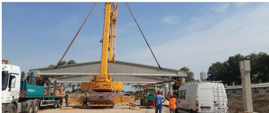
Slika 5. Montaža primarnega dvokapnega prednapetega nosilca na montažne AB-stebre.