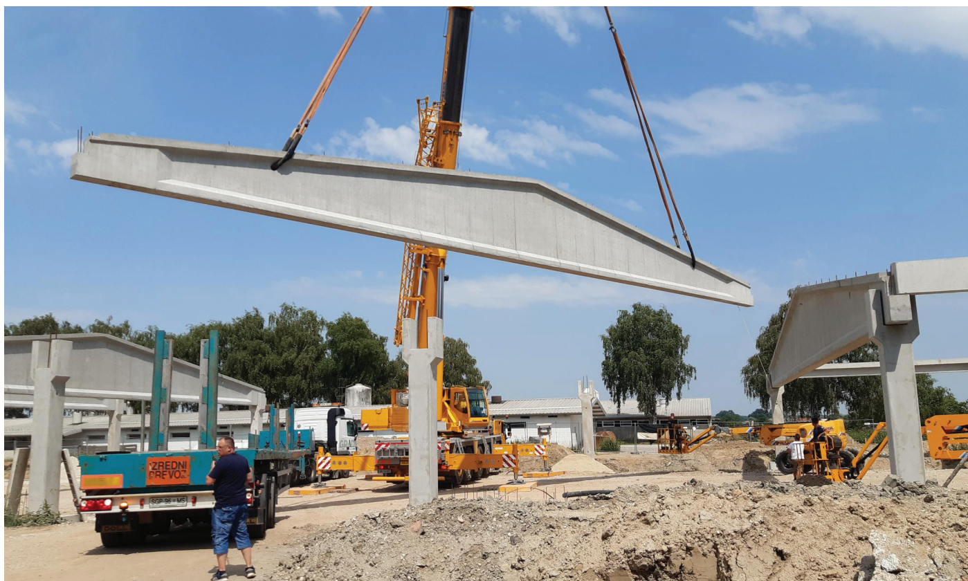
Slika 1. Dvig primarnega dvokapnega prednapetega nosilca z razpetino 32 m.