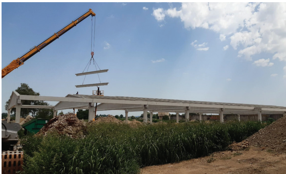
Slika 6. Montaža sekundarnih nosilcev na primarne dvokapne nosilce.