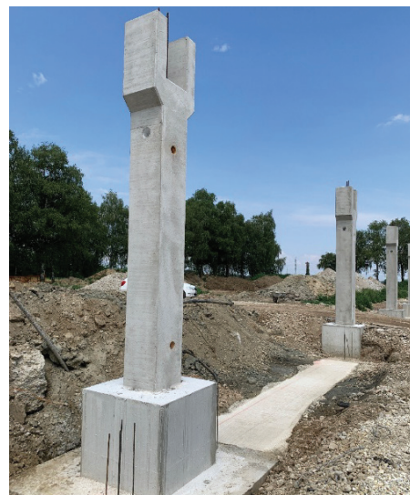
Slika 3. Vgrajena AB-čaša v peto temelja in montažni AB-steber.