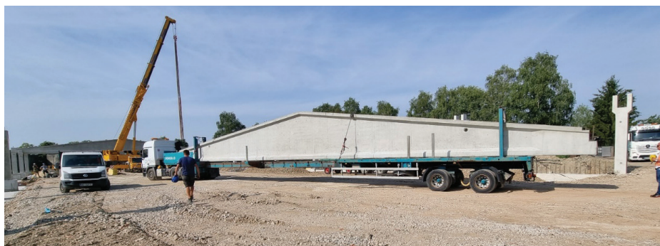
Slika 4. Transport primarnega dvokapnega prednapetega nosilca z izrednim prevozom.