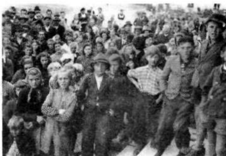
Pionirji napeto poslušajo govornika na mitingu v Žireh oktobra 1943