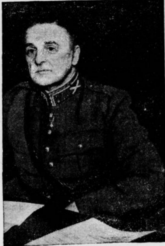
Iz Amsterdama poročajo, da so Nemci odvedli v ujetništvo vrhovnega poveljnika nizozemske vojske generala Winkelmana, baje zavoljo tega, ker se ni v celoti pokoril nemškim ukrepom glede demobilizacije