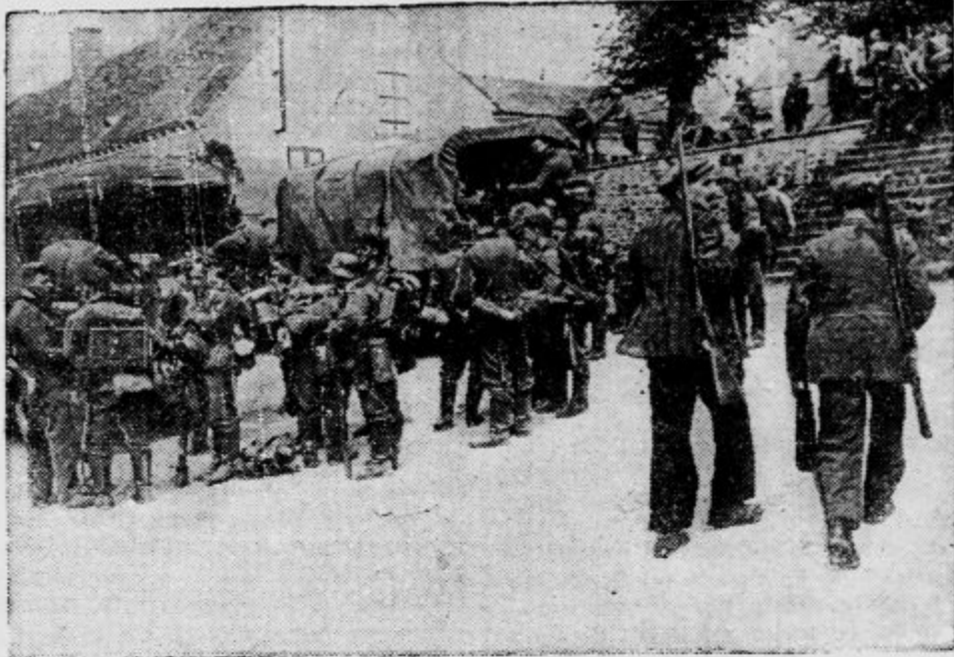
Po določbah premirja med Francijo in Nemčijo morajo vsi civilisti v Franciji izročiti orožje nemškim vojaškim oblastim