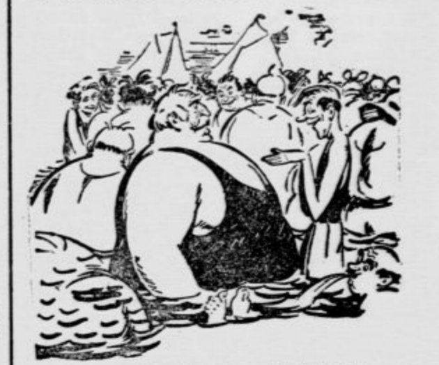
»Tolsti prijatelj, ali ne bi hoteli malo ulekniti trebuha, da bi se mogel vsaj enkrat tudi jaz potopiti pod vodo?« (College Humors)