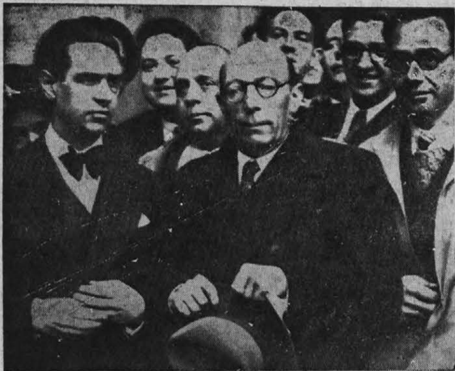
Španski ministrski predsednik Samper, ki ima sedaj velike preglavice radi spora s Katalonijo, oblegan od novinarjev