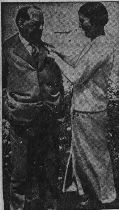
Španski general Sanjurjo, vodja protirepublikanske vstaje, ki je bil pred nedavnim pomiloščen, s svojo ženo

so bili že poslani vzorci v Argentinijo in tukajšnji velegradbeniki so bili brez izjeme navdušeni za to stvar. Nasvetovana družba, ako se ustanovi, naj nikar ne pozabi napeti vse sile, da se ji priključi imenovani tovarnar, ker ima v svojih rokah predmet, ki mu je že v naprej zasigurana lepa bodočnost.