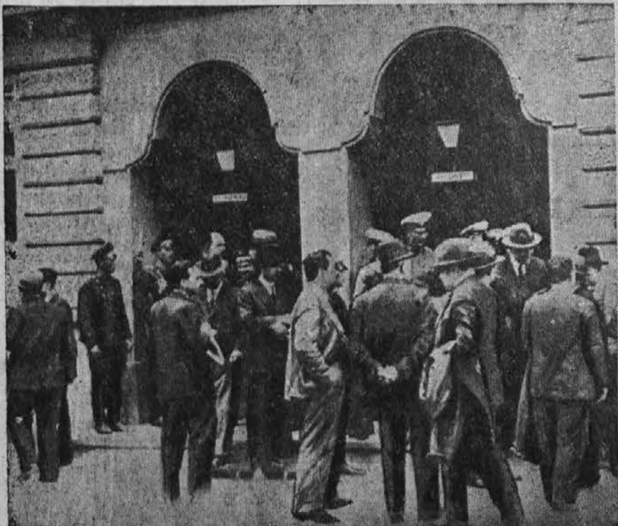
Članj nove vlade, katero vodi general Georgijev, zapuščajo, kmalu po izvršenem državnem prevratu, poslopje policijskega povračilništva v Sofiji

In šele tedaj, ko bodo vsi Jugoslavoani na lastni zemlji svoji gospodarji, postane Vidov dan praznik veselja in radosti, postane Vidov dan praznik popolne in neskaljene svobode.