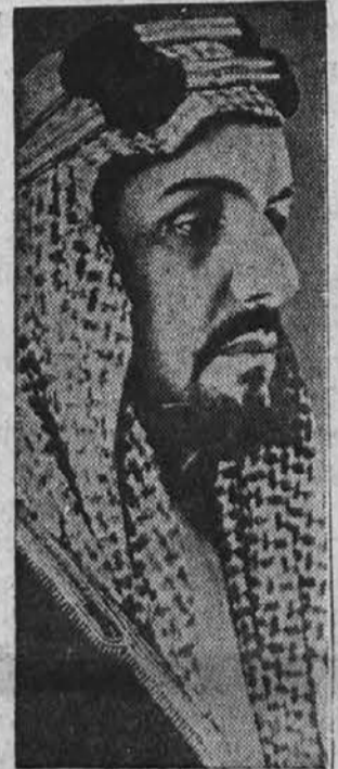
Ibn Saud, saudski vladar, ki bi rad postal gospodar Arabije

Končno so pa le sklenili mir v Arabiji. Izgleda, da sta se jemenski imam