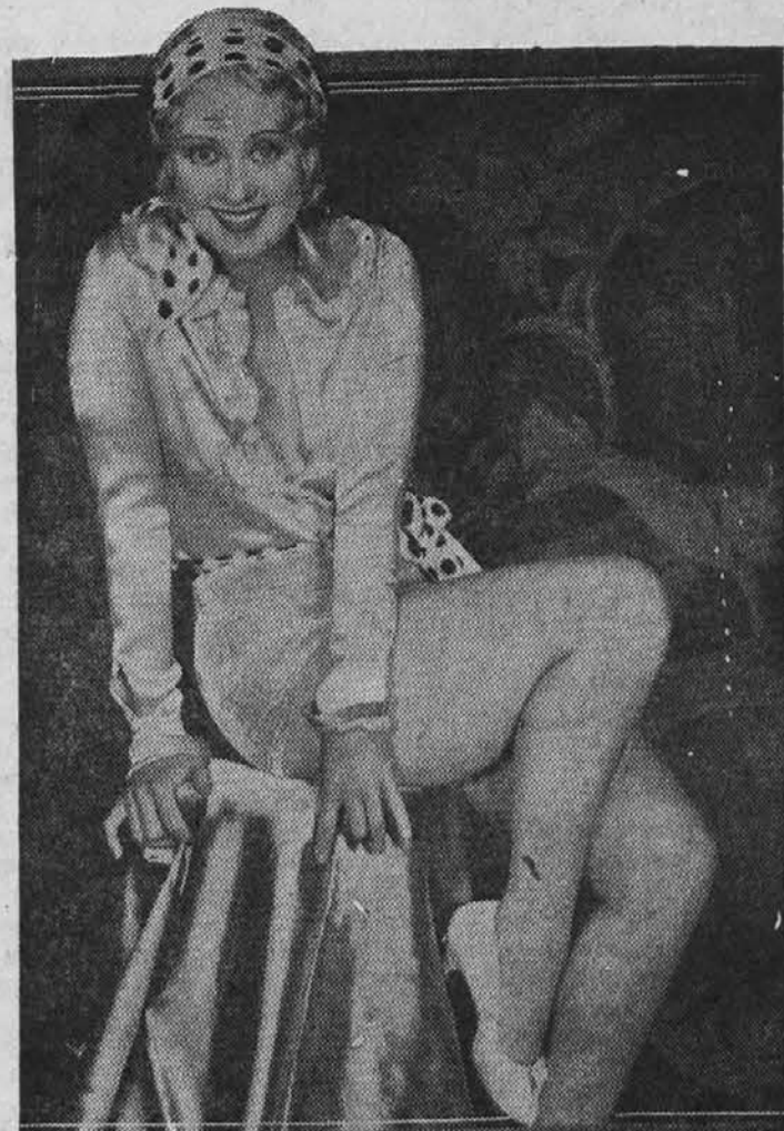
Znana filmska igralka Joan Blondell pričakuje v kratkem dogodek, s katerim bo srečala svojega moža Geor gea Barnesa. Te je že nekaj neobičajnega. O filmskih zvezdah je svet že poza bil, da morejo postati tudi matere.

je mogel uporabiti lastno orožje, se je sražnik zgrudil ranjen s konja, ki se je tudi kmalu zvalil na tla, zadet od več krogel.