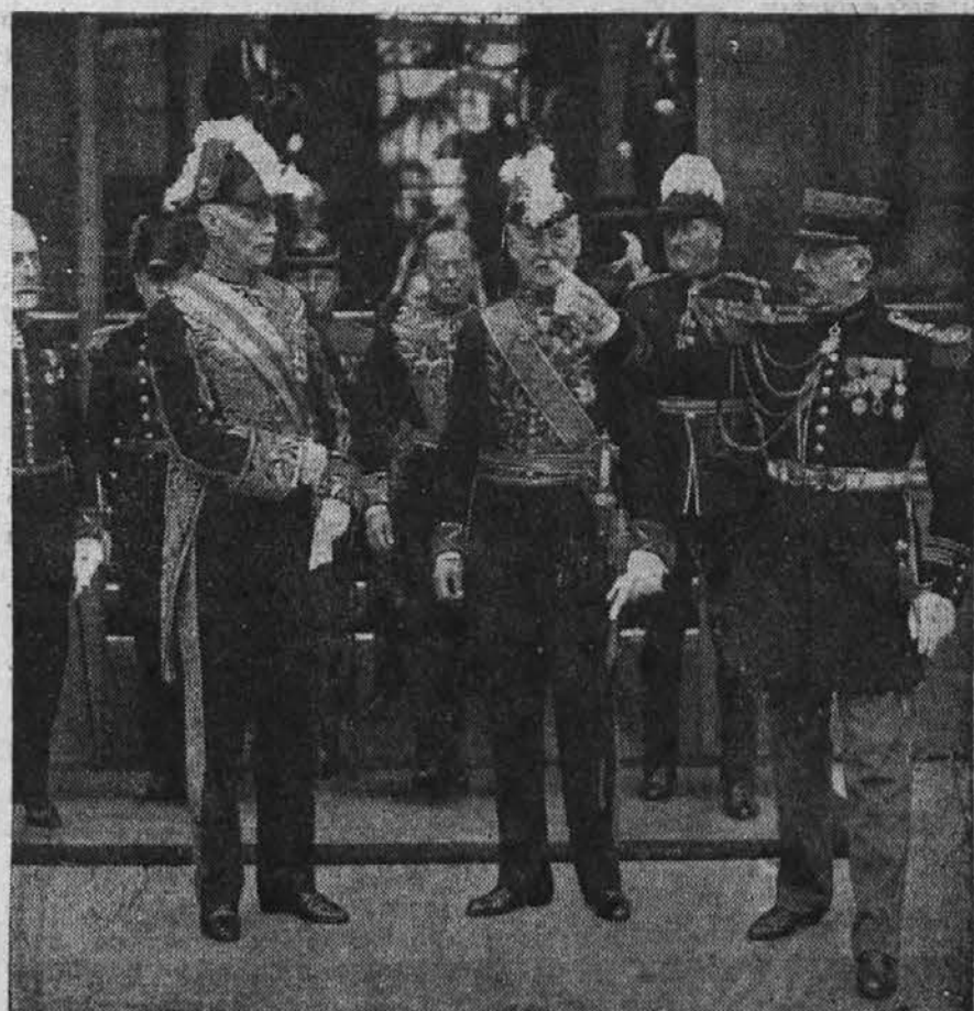
Novi angleški poslanik v Parizu Sir George Clark je posejil francoskega državnega predsednika Lebruna

Poseben pomen ima seveda evharistični kongres za verno ljudi, ki ga pripravljajo, se zanj žrtvujejo in hočejo predvsem svoje duše pripraviti za dostojno javno proslavo svojega Učenika in Mojstra, zavedajoč se, da