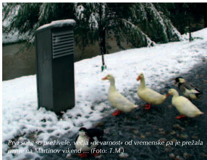
Prvi sneg so preživele, večja »nevarnost« od vremenske pa je prežala nanje na Martinov vikend ...

Ob koncu tega padavinskega dogodka na zaključku oktobra nas je obiskal še prvi sneg letošnje šele prihajajoče zime (5 cm 29. 10.). Že v bližnji Komendi ga je zapadlo enkrat več! Dva okto- brska dneva s snežno odejo (in pri sosedih štirje ...) pač nista od muh, predvsem pa se njeni sledovi poznajo v naših gozdovih, kjer je obležalo na tleh kar nekaj dreves in številne veje. Ker je večina listja takrat še vztrajala na drevju, je to prestreglo več snega kot pozimi. Vzponi na bližnjo Rašico oziroma Vrh Staneta Kosca z razglednim stolpom bodo na delih poti kar nekaj časa zahtevali krajše obvoze. Več dreves in vej je polomilo tudi po trzinskih ulicah ter obeh športnih parkih in na promenadi ob Pša- ti. Oktobrška moča je več kot dobrodošla za bodoče zaloge pitne vode, predvsem podtalnice, žal pa ni mogla nič več pomagati ti- stim letošnjim pridelkom, ki jih je odnesla suša oziroma jih zaradi nje sploh ni bilo. A pustimo se presenetiti naravi, ki se takole poi- grava z nami, saj smo tudi mi do nje vse bolj malomarni! Upajmo,