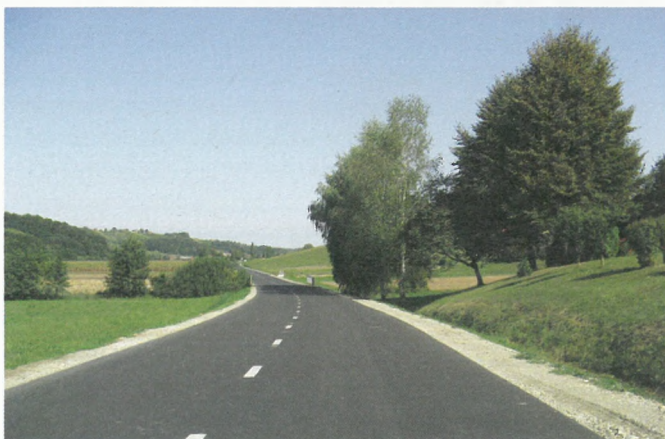
Modernizirani Cestni odsek LC Ormož-Sv. Tomaž v naselju Gornji Ključarovci-Hranjigovci.

V letu 2011 smo nadaljevali z investicijami v cestno infrastrukturo. Cestno omrežje po naši občini je zelo razvejano.