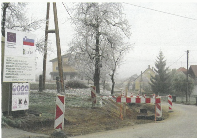
Izgradnja pločnika v centru Sv. Tomaža z metorno kanalizacijo in javno razsvetljavo.

OPERACIJO DELNO FINANCIRA EVROPSKA UNIJA Evropski sklad za regionalni razvoj