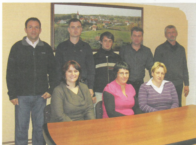
Novoizvoljeni člani občinskega sveta občine Sv. Tomaž.

Vse lastnike gozdov, ki neposredno gravitirajo na cestno telo, ponovno naprošamo, da skrbijo za posek vej in drevja, ki sega v profil ceste.