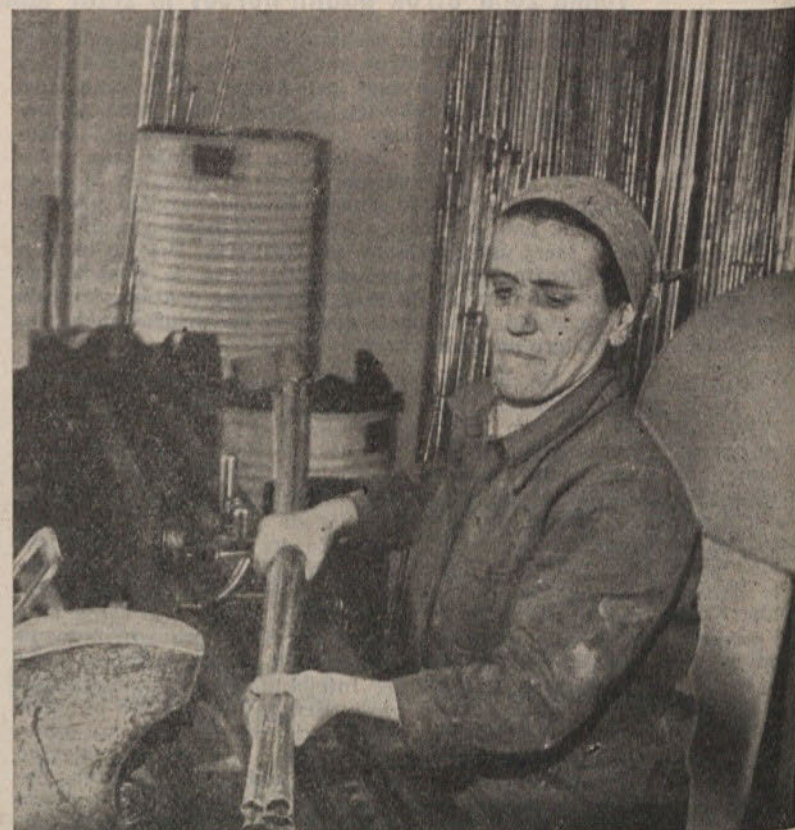
Obrezovanje bergmanovih cevi

S tehničnimi nasveti in navodili je tehnično-informativna služba v stalnem stiku s svojimi odjemalci. Po potrebi in želji kup-