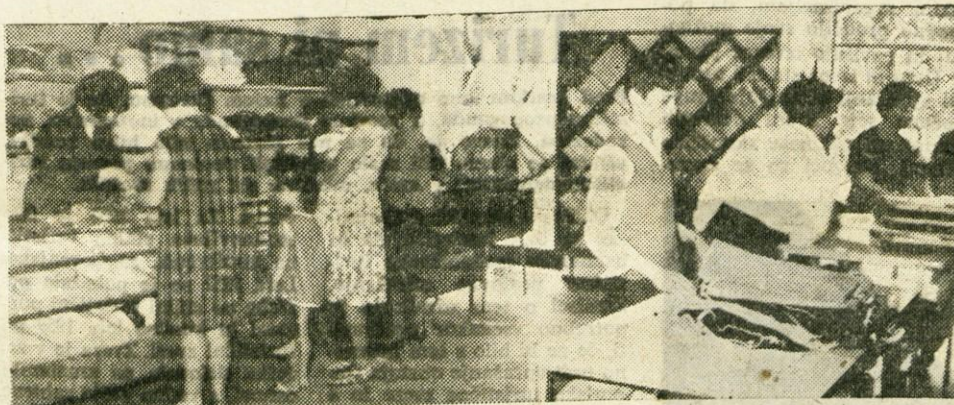
Trgovsko podjetje Zivila v Kranju, ki je z 62 poslovalnicami znano potrošnikom od Kranjske gore do ljubljanske meje, je pred dnevi odprlo novo urejeno prodajalno tudi v Skofji Loki na cesti talcev (pri starem mostu). Sodobno urejeni lokal in velika izbira blaga privablja tjakaj veliko kupcev