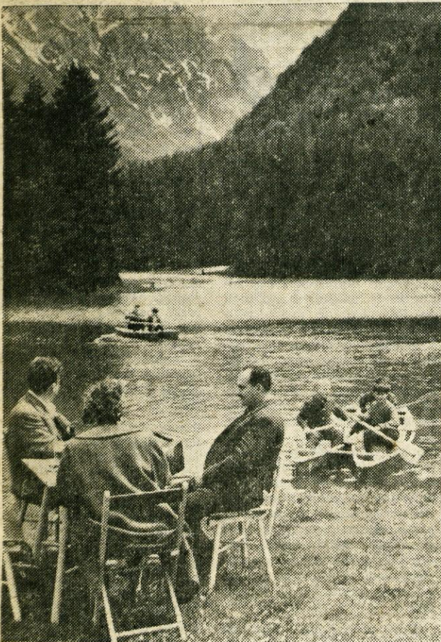
Plansarsko jezero na Jezerskem, ki je zlasti v ten vročih dneh zelo privlačno, bo jutri prizorišče težko pričakovanega srečanja Kokrških in Koroških partizanov v sklopu obsežnega praznovanja krajevnega praznika in počastitve 20-letnice osvoboditve

V četrtek je bilo v Tržiču posvetovanje o aktualnih nalogah pri uveljavljanju pomembnih gospodarskih ukrepov za razvoj gospodarskega sistema in družbeno ekonomskih odnosov. Posvet je sklicalo predsedstvo skupščine občine Tržič, sporazumno z vodstvi političnih organizacij, vabljeni pa so bili vsi direktorji, predsedniki samoupravnih organov, sindikalnih podružnic in mladinskih aktivov, sekretarji osnovnih organizacij ZK, vodstva političnih organizacij ter načelniki in referenti pri skupščini občine Tržič.