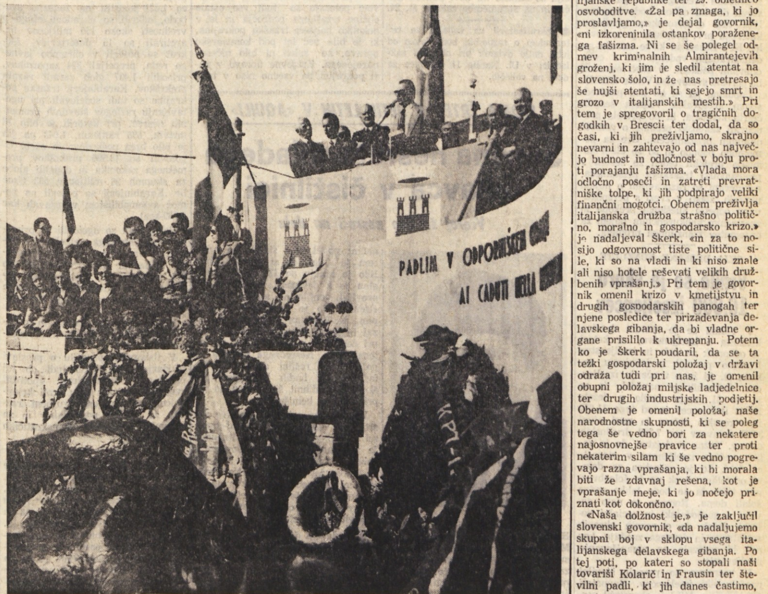
Z nedeljske svečanosti ob odkritju spomenika pri Korošcih