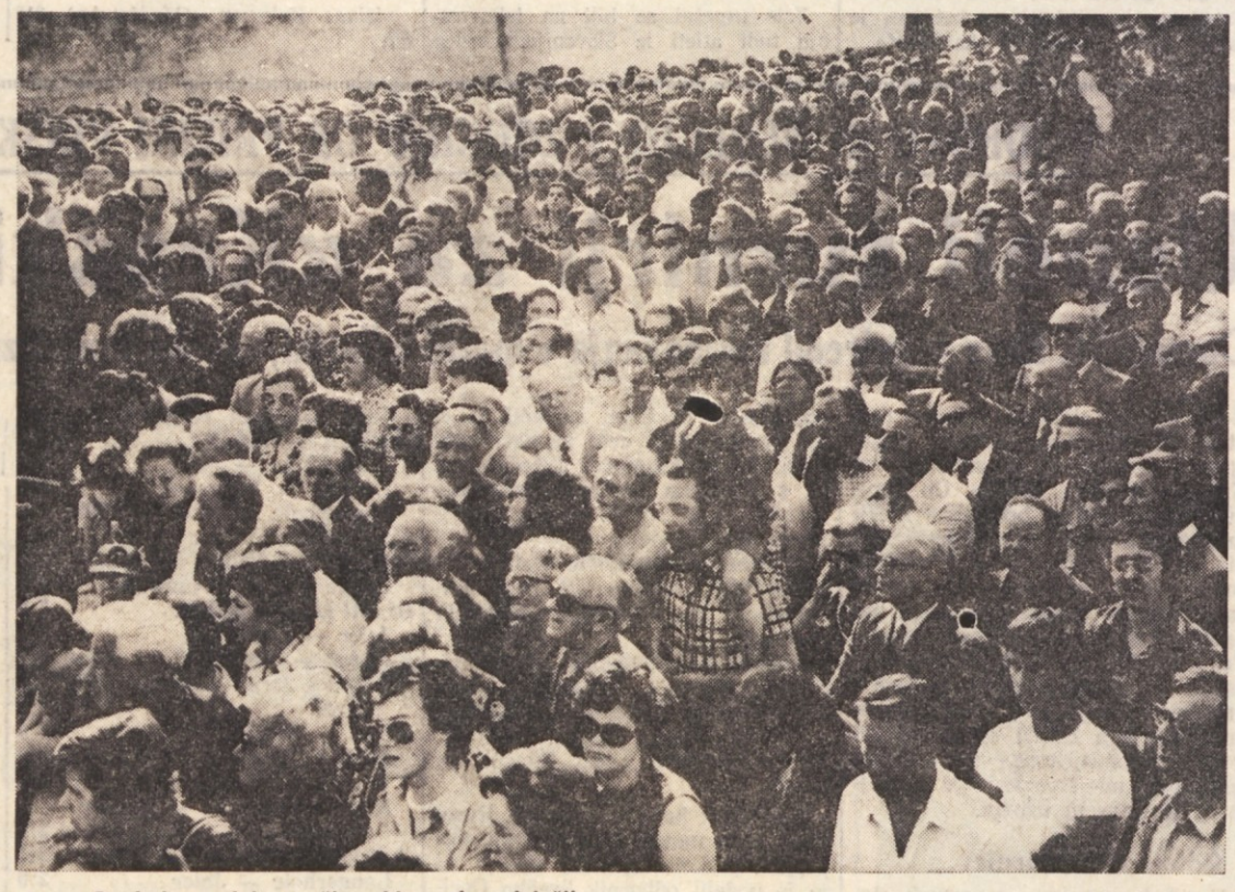
Pogled na del množice, ki se je udeležila velikega slavlja pri Korošcih