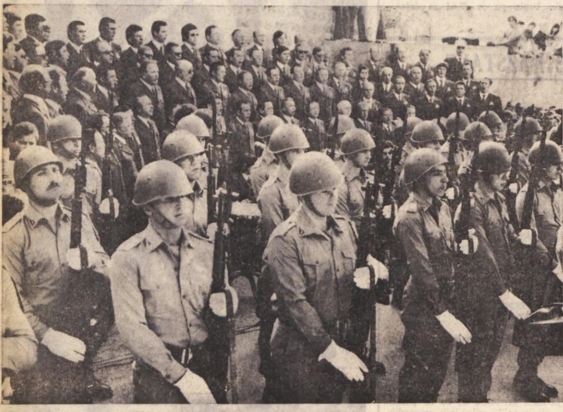
Vojaški vod od Lazareta izkazuje čast padlim, Tržaški partizanski pevski zbor pa poje «Žrtvam»