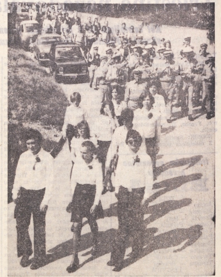
Ob zvokih godbe iz Kočevja korakajo gostje in domačini na prireditveni prostor