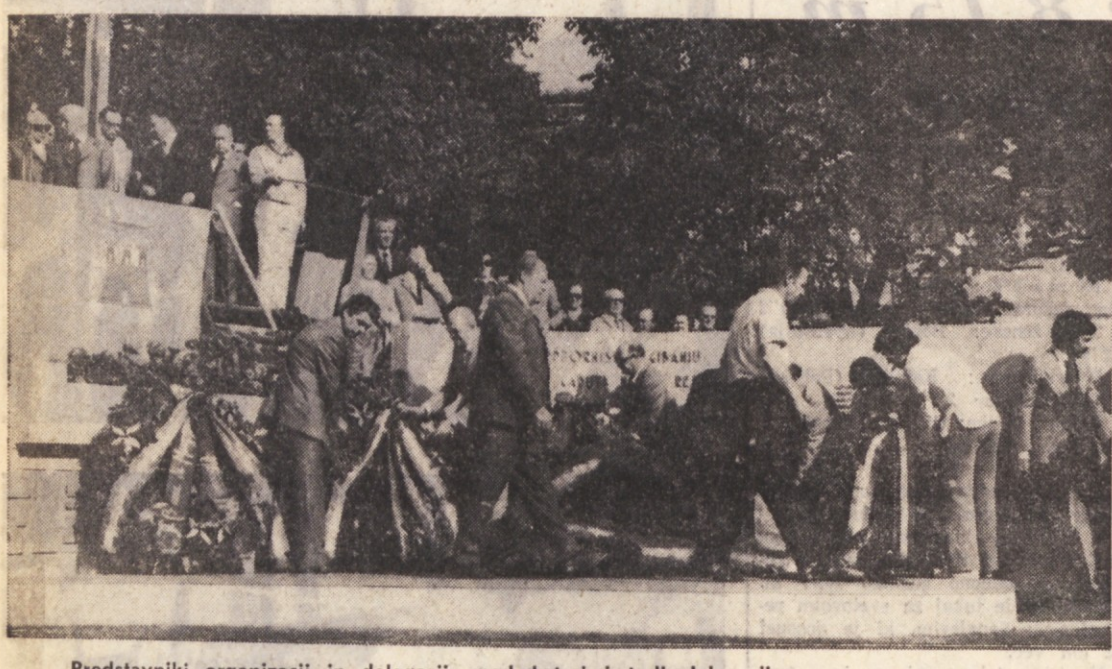
Predstavniki organizacij in delegacij, med katerimi tudi delegacija Zveze borcev iz Kopra, polagajo vence ob spomenik

V Miljskih hribih ne pomnijo takega slavlja, kot je bilo v nedeljo pri Korošcih, kjer so odkrili spomenik padlim domačinom v osvobodilnem boju. V to prijazno vasico, od koder je krassen razgled na morje, Trst, Breg in Kras, je prišla iz mesta in s podeželja, s to stran in onstran meje, množica ljudi, ki so se poklonili spominu padlih in izpričali svojo zvestobo idealom osvobodilnega gibanja ter odločnost v boju proti zločinske- mu neofašizmu