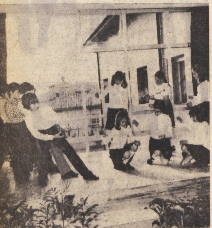
Sobotni kulturni spored v šoli «Fr. Levstik» je obsegal tudi recitacije. Na sliki: dijaki recitirajo «Lepo Vido»

V srednji šoli na Proseku so v soboto proslavili zaključek prvega leta poskusnega pouka s celodnevno zaposlitvijo. Na sliki: del občinstva ter številnih gostov, ki so se udeležili zaključne prireditve