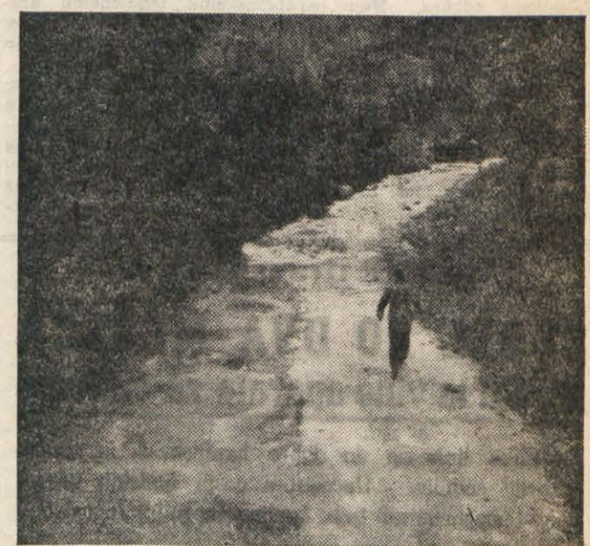
Zamrzjena Glinščica v Boljuncu.