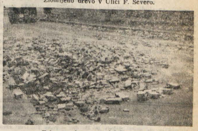
Take so skoro vse tržiške ulice.