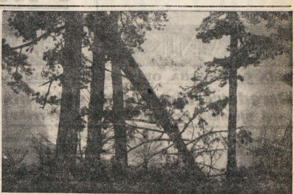
Polomjeni bori med Padricami in Bazovico.

»Središče vsega je velika dvorana. Tu je zbrana n. pr. celotna angleška kraljevska družina, Mahatma Gandhi, Greer Garson, kraljica Viktorija in general Eisenhower, Napoleon in Joe Louis. Tukaj stoji tudi sama Madame Tussaud, drobna postavica z očali, v obleki in čepici iz črne svile. Ta njen voščeni avtoportret je njena največja mojstrovina. Dokončala ga je, ko ji je bilo 82 let, čeprav je živelja še do 90. leta starosti.