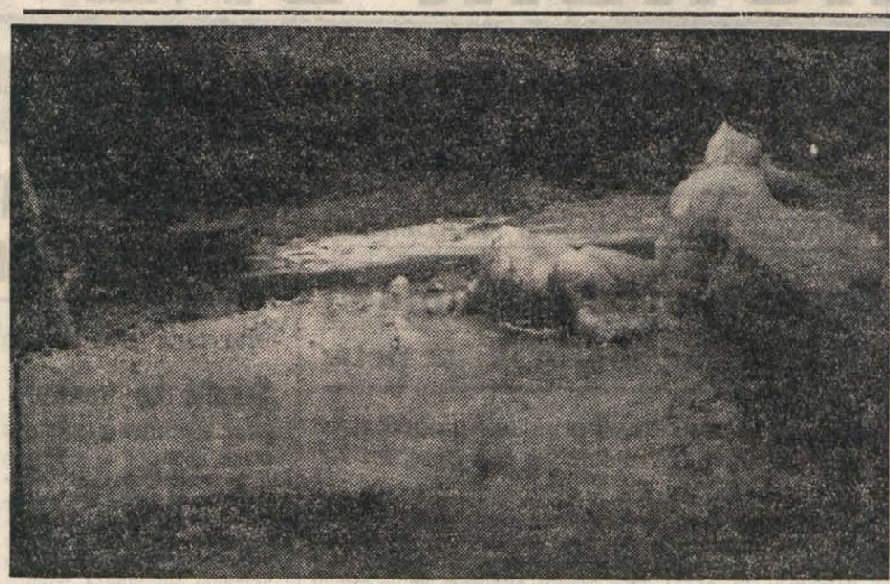
Zamrzjeno napajališče v Devianu.