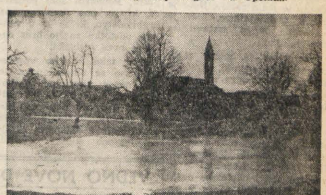
Zamrznen kal v Bazovici.