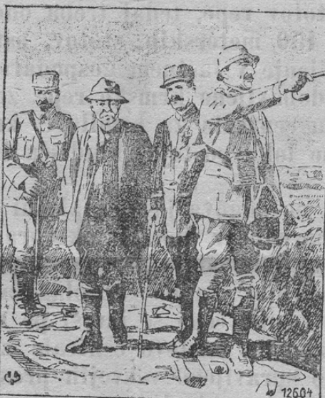
Der franz. Ministerpräsident Clemenceau besucht die Schlichtfelder an der Somme.

Naša slika kaže francoskega ministerskega predsednika Clemenceau, ko obiskuje bojišča ob Sommi. To je bilo seveda pred