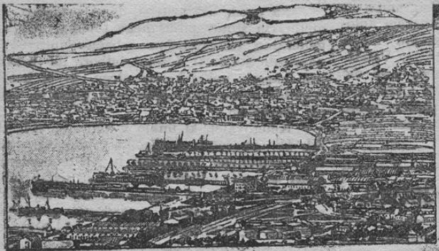
Am. Hafen von Odessa.

Vsacega nabiralca podpisov za „jugoslovansko deklaracijo“ naj se takoj naznani najbližjemu orožniku ali pa policaju, oziroma naj se politični oblasti njegovo ime sporoči!