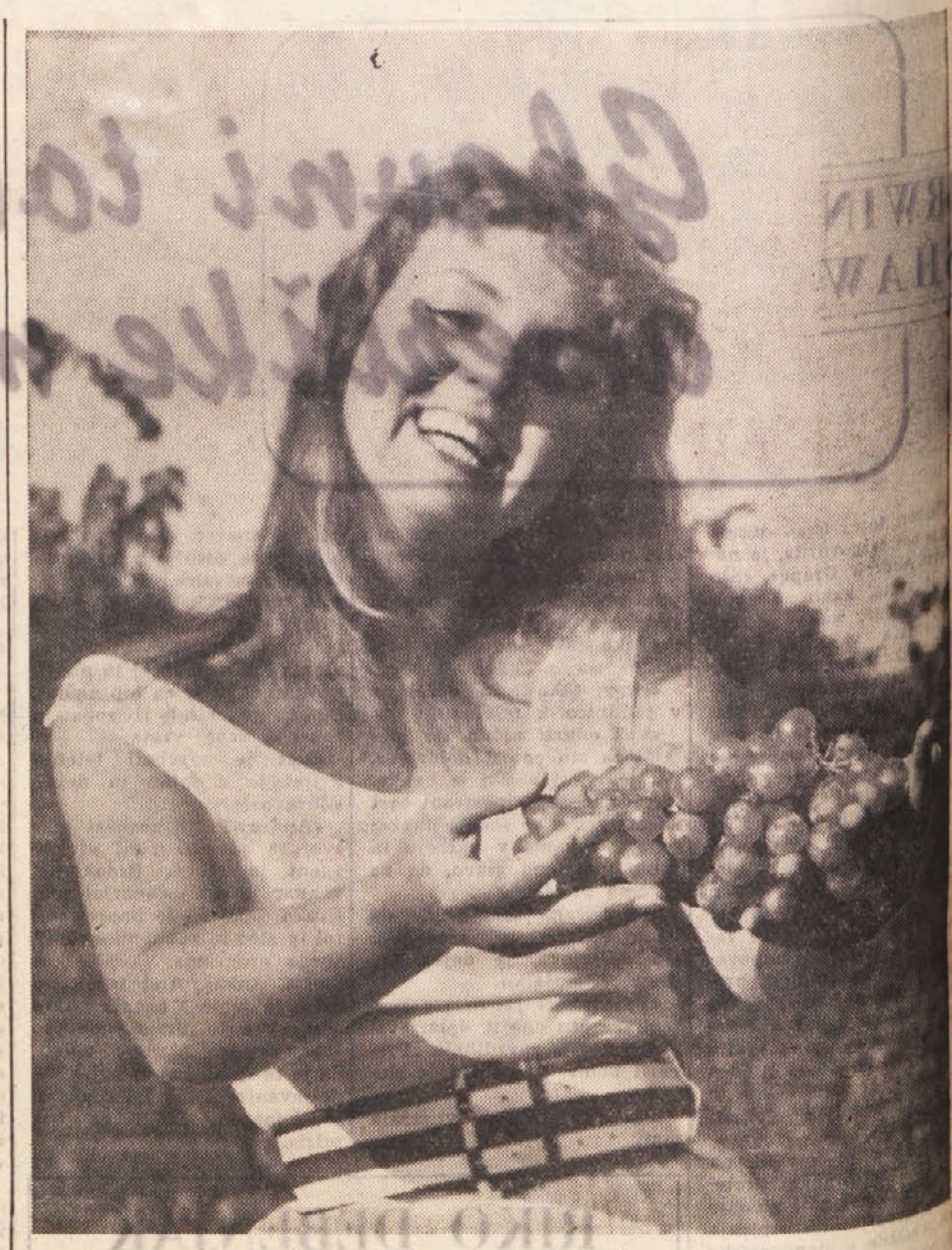
Cedno dekle vam ponuja lep grozd