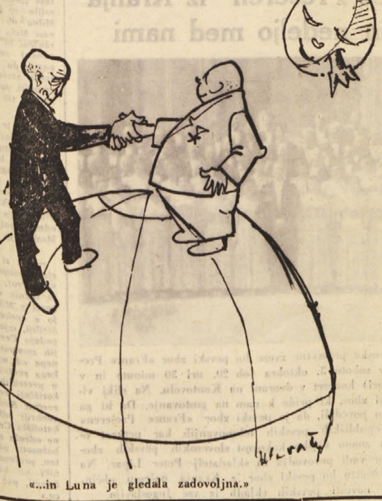
«...in Luna je gledala zadovoljna.»