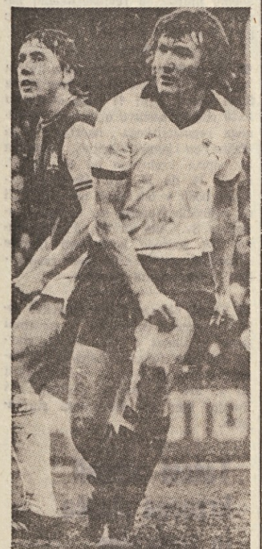
John Toshack, član Liverpoola in waleske reprezentance. Toshack je zlati konica napada Walesa

Wales se je nepričakovano uvrstil v četrtfinale. Od britanskih reprezentanc je torej najdaljšo pot napravila prav ta reprezentanca.