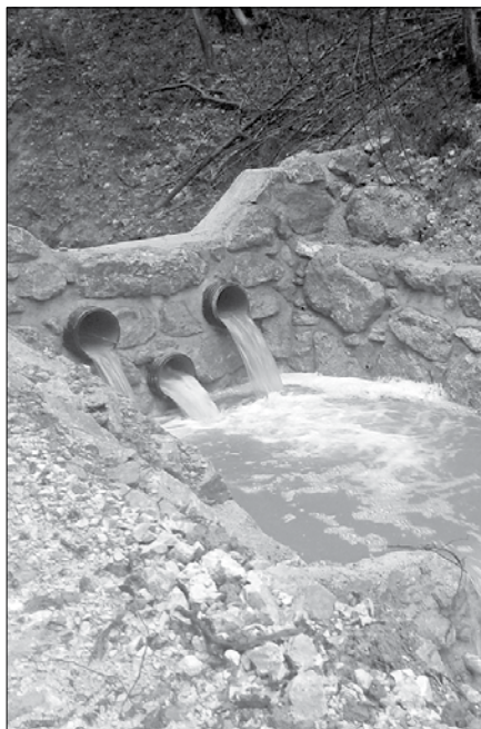
Prodna pregrada na Okoninskem potoku

V občini Ljubno se po katastrofalnih poplavih novembra 2012 izvedli že nekaj ukrepov, da v prihodnje do tako hudih posledic ob velikih vodah ne bi več prihajalo. Še vedno pa jih čaka na tem področju kar nekaj nalog. Eno od bolj ogro-