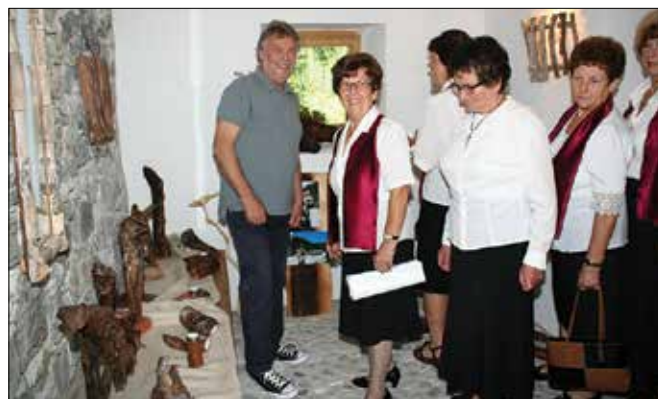
Za nekatere odpadke, za druge lep ali celo uporaben kos lesa

Kot je povedal avtor sam, tu in tam poudari posamezno lastnost najdenega kosa lesa le s tankim premazom običajne kreme za čevlje. Sicer ne dodaja in ne odvzema nič, tako, da ostajajo predmeti oziroma lesene »skulpture« povsem naravne. Na tokratni razstavi je bilo mogoče občudovati 80 eksponatov.