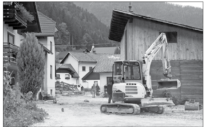
V Krnici urejajo kanalizacijo in prenavljajo ostalo javno infrastrukturo.