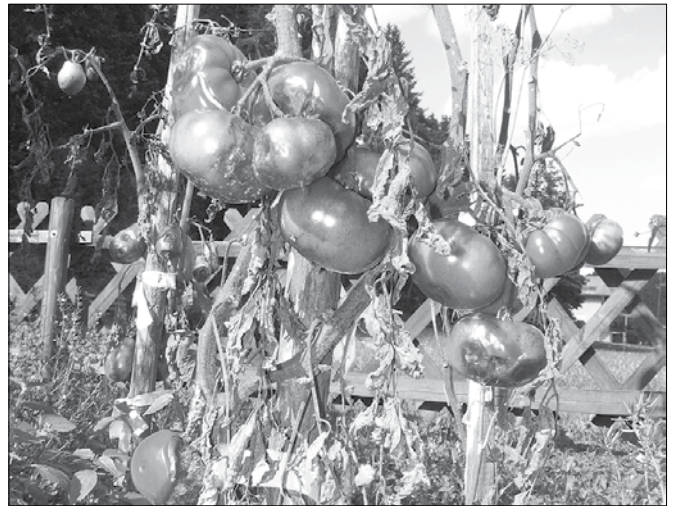
Paradižnik, ki ga je uničila plesen.

der so nad nas zadnja leta prihajali značilni suhi in vroči zračni tokovi. Lani in predlani smo tako beležili ekstremno vroče poletje, verjetno se nam letošnja namočenost in nižje temperature zato zdijo toliko bolj neobičajne. Čeprav se letošnje poletje ne bo uvrstilo med najbolj vroča, pa bo blizu zlate sredine. Vendar takšni podatki nič kaj ne tolažijo kmetovalce, ki so jim ve-