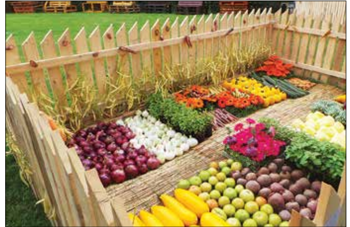
Nori gartelci so bili domiselno narejeni.

Tradicionalno so se tudi letos vrtnarjem in cvetličarjem pridružili člani društva Bioexo iz Ljubljane, ki so pripeljali na ogled različne vrste kač in ostalih plazilcev. Tokrat prvič so se po priložnostno postavljeni mo-