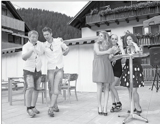
V časih današnjega dne mladina žurira pozno v noč naslednjega dne.

Potem so igralci skočili v obdobje, ko je imel besedo pri hiši go-