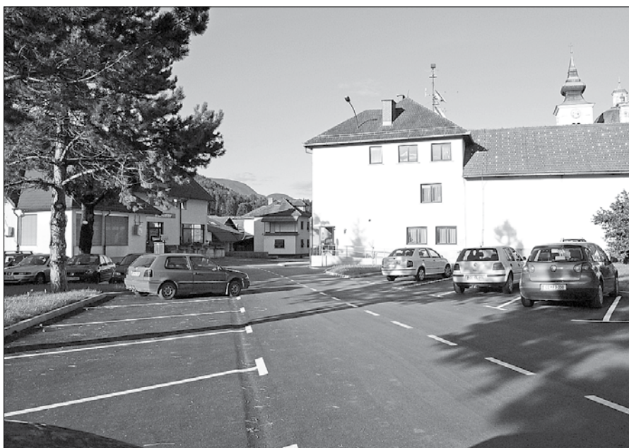
Novo parkirišče v središču Gornjega Grada