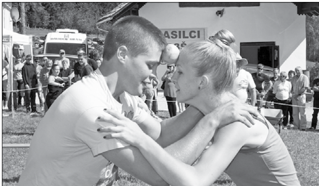
Tole zgleda veliko bolj enostavno, kot je.