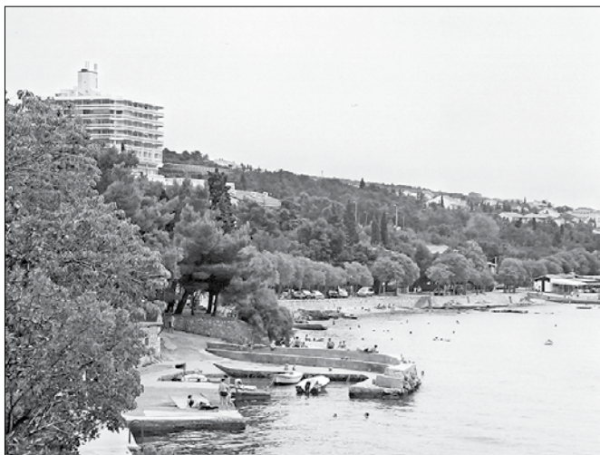
Včasih je bila plaža pod domom v Dramalju polna Zgornjesavinjčanov. V ozadju je znan hotel Omorika.

Meni ni bilo enostavno prevzeti v upravljanje doma, ki je imel stalno kakšne potrebe po vzdrževalnih posegih, bomo opremo in je bil vedno pretesen za vse, ki bi radi poceni preživeli dopust ob zaželenem morju. Vsako leto je po pol leta zgradba samevala in po svoje propadala, a smo jo vedno nekako usposobili za dobre tri poletne mesece. Ker ni bilo dovolj prenočišč v osrednji zgradbi, smo iskali ležišča pri domačinih, jedilnica in prostor za srečanja pa je bil za vse skupen in pravi začasni dom Zgornjesavinjčanov.«