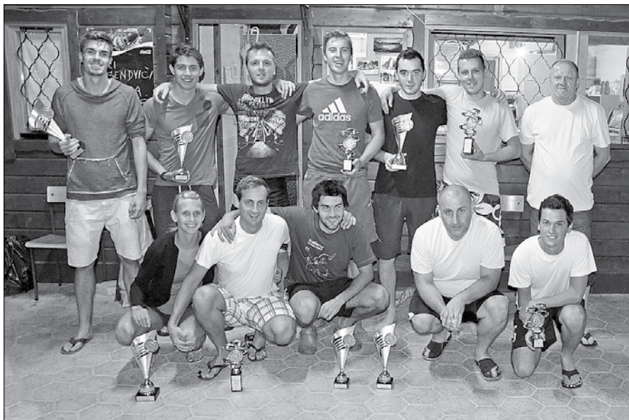
Najboljši igralci v družbi organizatorjev