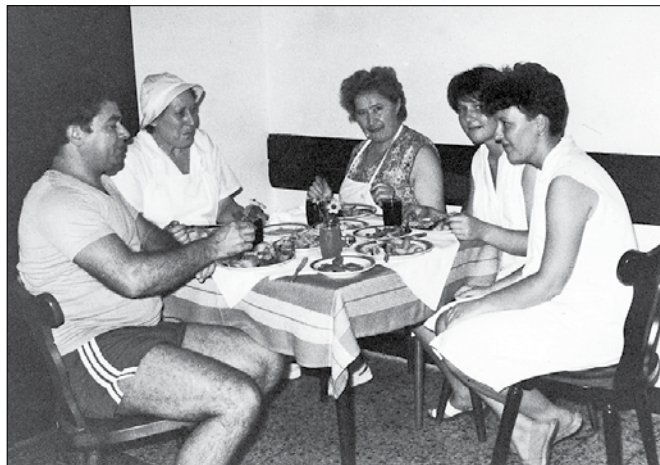
Ko so kuharice postregle sto in več gostov, so poskrbele še zase.

Po besedah Antea je bila glavna duša doma vedno ekipa, ki je skrbel za red, funkcioniranje in dobro, domačo prehrano. Prav z njo so bili v glavnem zadovoljni vsi, od delavcev do šefov. S primerno ceno je bil tako dopust dostopen tudi delavcem z najnižjimi plačami ter upokojujencem. V izvensezonskem obdobju so prihajale tudi »vikend« skupine.