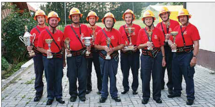
Tekmovalna desetina rečiških veteranov s pokali, ki so jih osvojili v letošnjem letu.