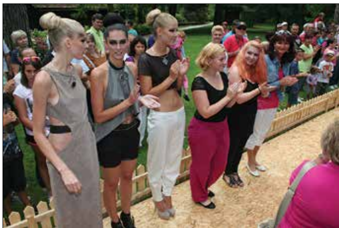
Manekenke, modna oblikovalka, vizažistka in oblikovalka nakita ob zaključku modne revije.

tem lahko ogledali različne druge kreacije, ki so bile postavljene po zelenih gredicah. Med njimi so se sprehajali liki iz Disnejevih risanih filmov, ki so pozdravljali najmlajše in se z njimi fotografirali.