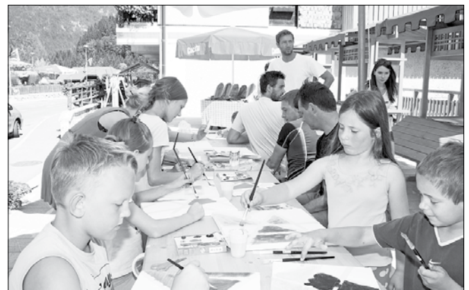
Otroci so med drugim ustvarjali z vodenkami.