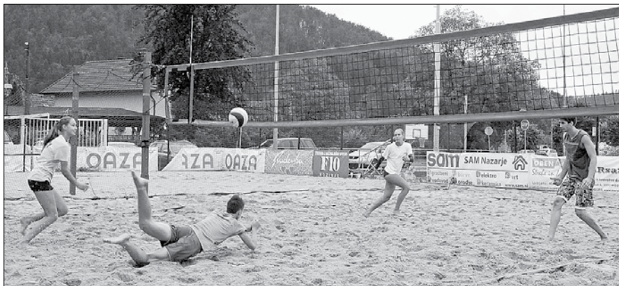
V Mozirju želijo postati poznani po turnirju mešanih parov.

V petek, 15. avgusta, se je na mozirskem igrišču na mivki odvijal rekreacijski turnir mešanih dvojk v odbojki. Organizatorjem jo je zagodlo mrzlo, deževno vreme in namesto desetih prijavljenih ekip se je turnirja udeležilo le pet. Zmagoval-