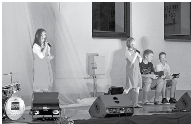
Mladi izvajalci so pokazali veliko mero znanja in talenta.