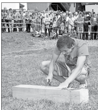
Ko se vse vrti okoli tebe, še svet ni pri miru, kaj šele žebelj, kladivo in roka.

se pomerili v nošenju jabolka s čeli. Dva člana ekipe sta si namestila jabolko med čeli in ga tako nosila skozi postavljene ovire do vedra. V drugi igri se je vsak član ekipe petkrat zavrteel okoli svoje osi, nato pa stekel do kladiva in z njim zabil žebelj v klado. V zadnji igri so drug drugega vozili v samokolnicah in tako premagovali ovire. Največ točk iz vseh treh iger so na koncu zbrali člani ekipe Razbor.