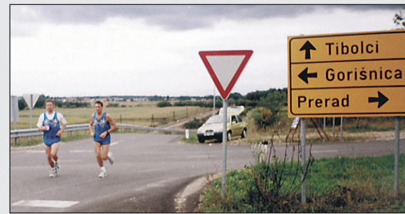
Maratonca na polovici poti med Ptujem in Ormožem.