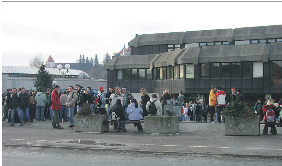
V dvajsetih minutah na svež zrak, klepet, čik ali malico.

strojni šoli pomenili za vas z vidika opremljenosti šole?