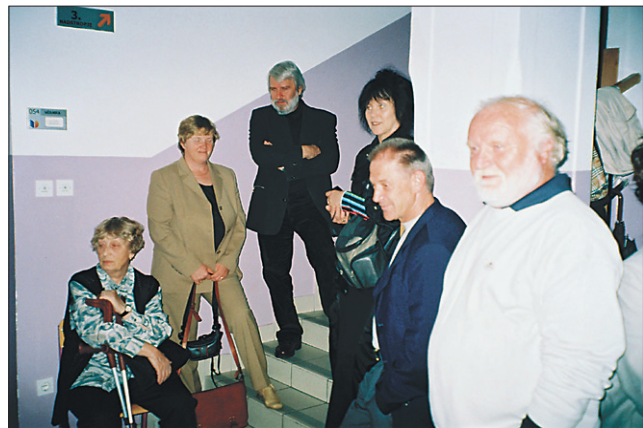
Umetniki na stopnišču osnovne šole, ko še je bila elektrika.