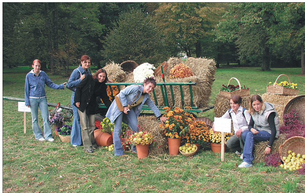
Lani so dijaki kmetijske šole pripravili razstavo cvetja in pridelkov na Turnišču.