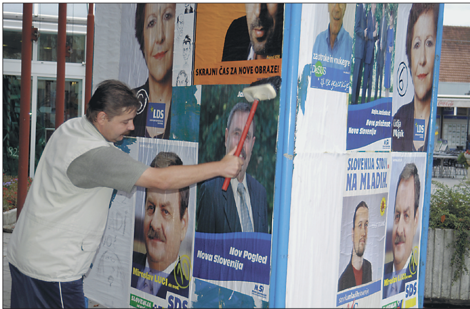
Plakati nas nasmejano vabijo na nedeljske volitve, ko bomo s svojim glasom "nagradili" delo sedanjih poslancev ali pa, razočarani, izbrali nove obraze ...