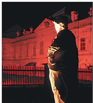
Dornavski dvorec je pričakal obiskovalce čarobno razsvetljen.