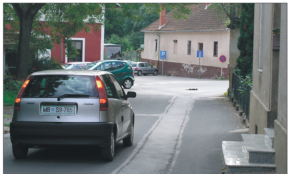
Tukaj se bodo v prihodnje križale polijske poti. Vidi se, da jo je tokrat skupila le mačka ...