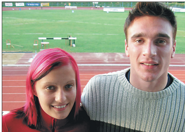
Kolaričeva in Sluga sta sklenila odlično sezono z bronom.

je bila za 21-letnega Ptujčana zelo uspešna in naporna, saj se mu je uspelo utrditi v vrhu slovenskega