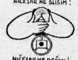
NIČEGAR NE REČEM!