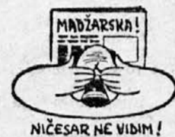
NIČESAR NE VIDIM!