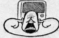
NIČESAR NE SLIŠIM!