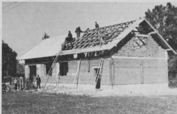
Gasilski dom Slovenja vas ob pokrivanju strehe