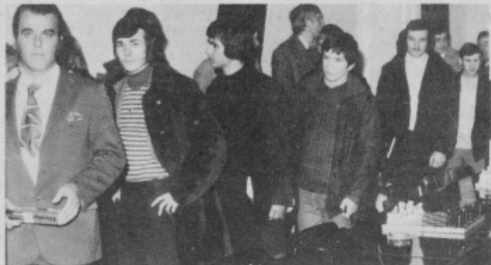
Mladi Ptujčani si ogledujejo prostore novega mladinskega kluba