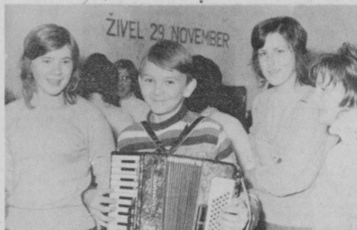
Posnetek proslave gojencev Dijaškega doma Ptuj.