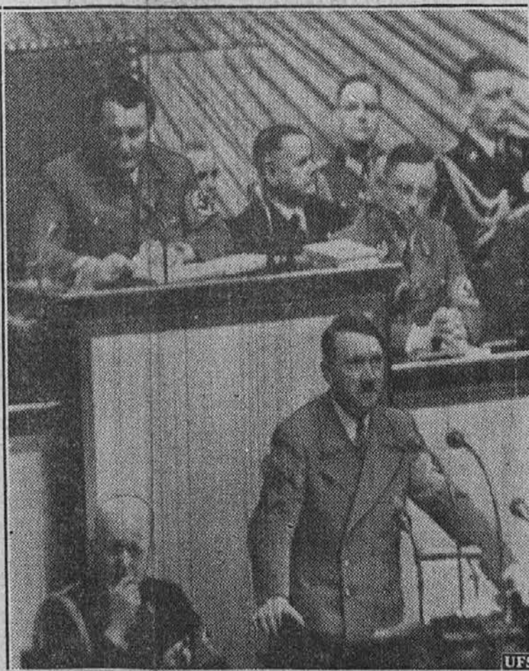
Na sliki vidimo nemškega firerja Hitlerja ob otvoritvi nemškega državnega zbora. Na vzhvišenem mestu za njim sedi maršal Goering, nacist št. 2.