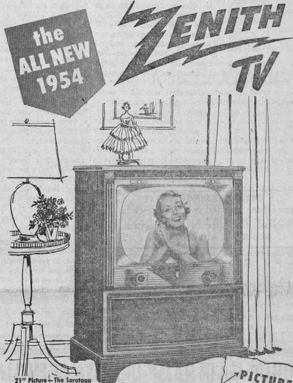
21" Picture - The Saratoga Model L2260R

V zabavo ob domačem krogu... naj bi vaša družina uživala najboljše. Zato ji preskrbite televizijski aparat priznanega izdelka. To je