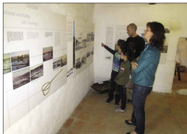
Panoji s slikovno spremljavo so zanimivi za več generacij

ki je izrazila zadovoljstvo ob visokem obisku na razstavah s Hrvaške in iz Slovenije. Po-