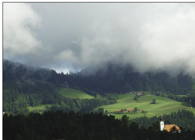
Lep razgled z okna vuzeniške šole

začeli s smešnimi igrami, potem pa se je zabava nadaljevala seveda s plesom. O, skoraj sem pozabila omeniti ogled elek-