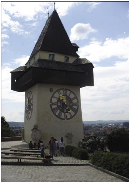
Edenajset ali dvanajset bau vora v Graci?

gor pela. Rejsan, v par sekundaj smo že vrkaj na takzvanom Schlossbergi bili, šteri je kak eden mali grad nad Gracom.