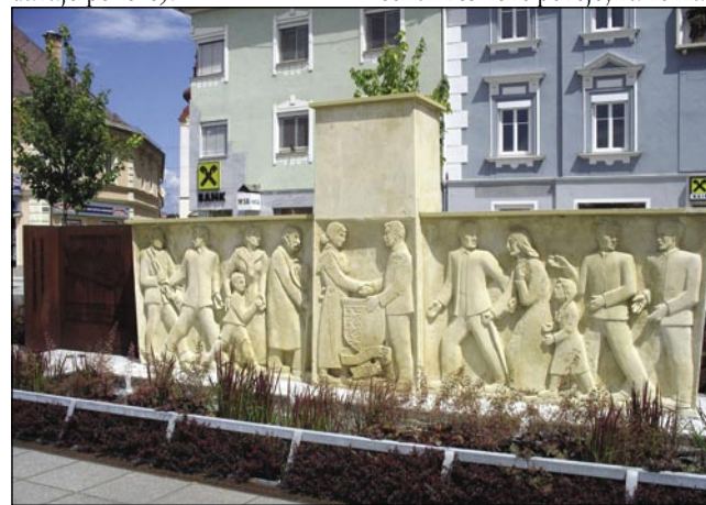
Spomenik za tiste, šteri so steli avstrijski Velikovci

je domanji Nemci tak zovéjo, ka prej ne gučijo gnakoga jezika, kak Slovinci na drugoj strani bregauv Karavank. (Pripovejst je skoro takša kak naša v Porabji). Ovak najdemo v Velikovci samo eden slovenski napis: »Posojilnica« (gde na pausado davajo peneze).