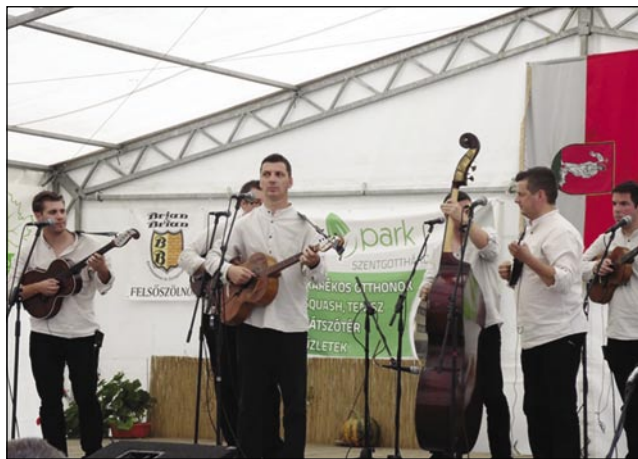
Hrvaška tamburaška skupina Koprive iz Petrovega sela

sambla West Alfa. Pel je značne pesmi iz musicalov. Potem je nastopila Gledališka skupina KTD Puconci, ki je prikazala skeč z naslovom