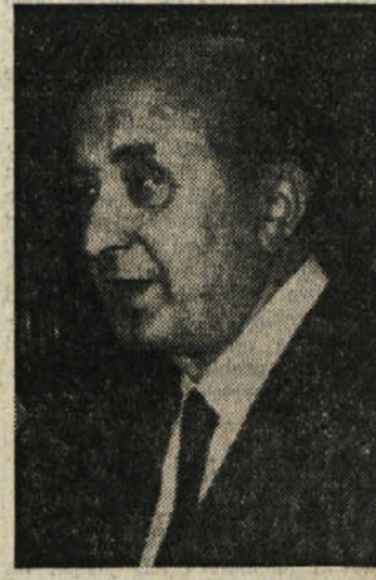
Ciriaco De Mita (KD)