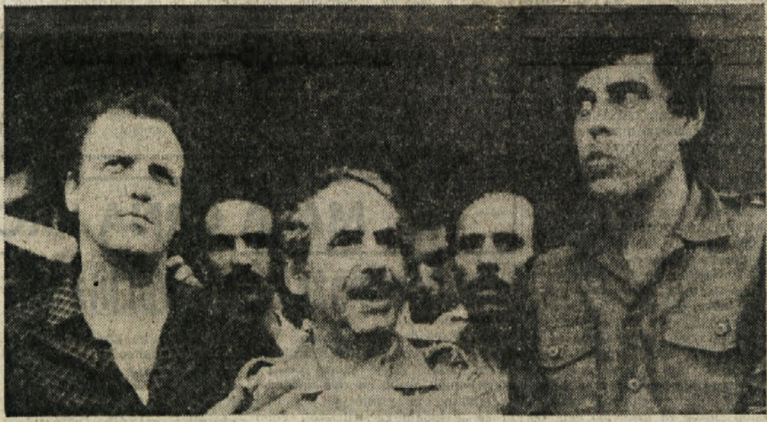
Ujeta izraelska vojaka, ki so ju sinoči izpustili Palestinci, se pogovarjata s časniki

Palestinci so sinoči izpustili ujeta izraelska vojaka - Italijanski bersaljerji bodo danes zjutraj izpluli iz Brindisija - Nevarnost sirsko-izraelskega spopada