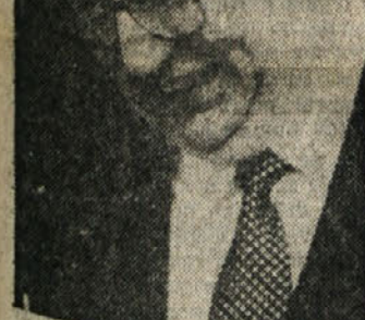
Sen. Giovanni Spadolini