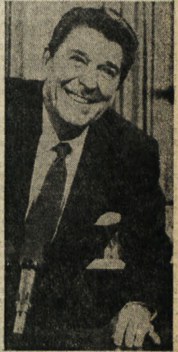
Ameriški predsednik Reagan