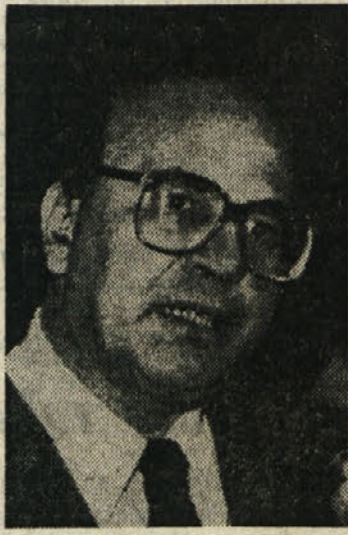
Bettino Craxi (PSI)