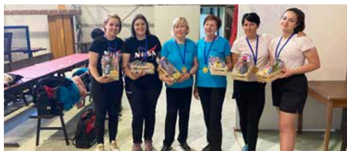
Ženske klubske dvojke