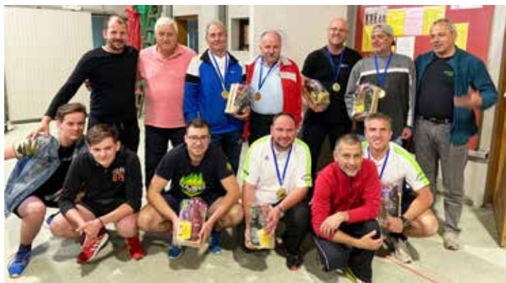
Moške klubske dvojke