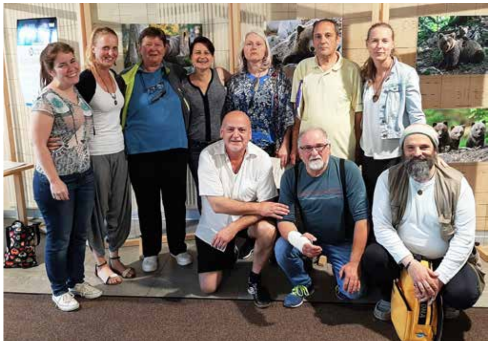
Pivška skupina udeležencev z vodjema izobraževanja

V Pivki je od februarja do srede junija, s prekinitvijo zaradi ukrepov v zvezi s pandemijo, potekala serija delavnic Slovenskega društva hospic, ki se jih je udeležilo deset bodočih prostovoljcev. Društvo, ki letos praznuje petindvajset let delovanja, s prostovoljci in strokovnim kadrom nudi podporo ljudem v trenutku nemoči sprejemanja življenjske resnice, da se nekomu življenje izteka. Cilj prostovoljcev društva je podariti sočloveku del svojega časa in s tem obogatiti tudi sebe. Na začetnem izkustvenem izobraževanju v obliki delavnic z obilo poglobljenega dela ob sodelovanju vodij izobraževanja so udeleženci pokazali veliko notranjih izzivov in med seboj delili intimne izkušnje iz sveta vrednot in pogledov na življenje, tudi ko se to neizogibno izteka. Tako so postali sočutni spremljevalci procesa umiranja in žalovanja. Kljub dobrim občutkom in pripravljenosti pa