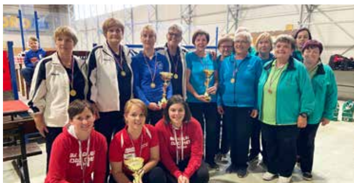
Ženski mednarodni turnir 3+1