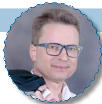
Zvone Černač, minister

Srečno, lepe dopustniške dni vam želim in ostanite zdravi.