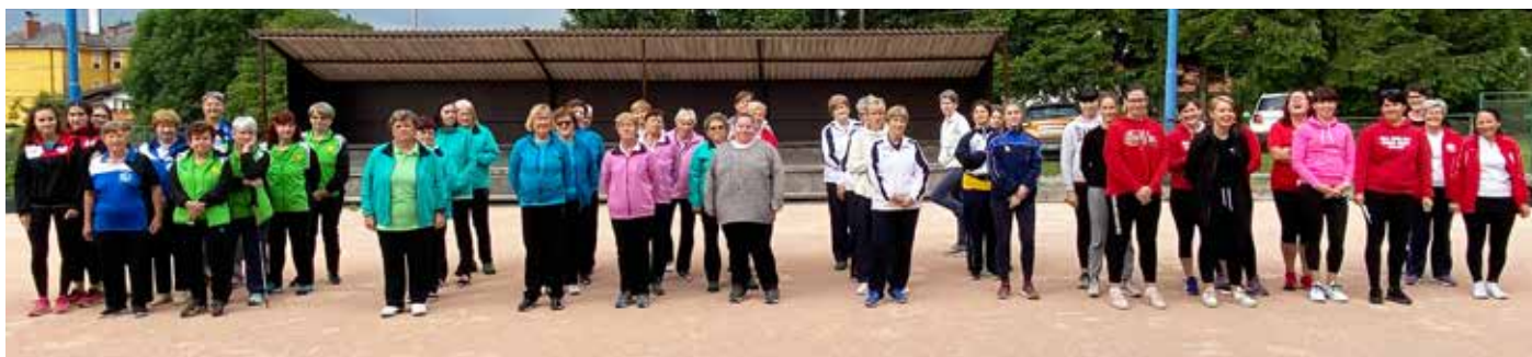
Ženski mednarodni turnir