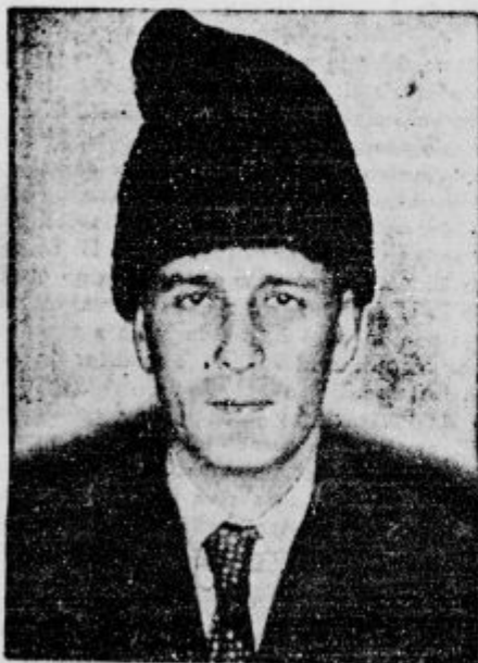
Cornelij Codreanu, voditelj romunske »Železne garde«, ki je bil ubit na prevozu iz jetnišnice Rim-sik Sarat v Ilavo, ko je skušal ob naročenem napadu pobegniti. Z njim vred je bilo ustreljenih še 13 njegovih pristašev

s Na pravi poti. Novi predsednik osrednje češkoslovaške vlade dr. Beran je imel te dni po radiu govor, ki ga je zaključil s sledečimi za novo Češkoslovaško značilnimi stavki: Naše življenje in delo za narod bo preveval krščanski duh in izročilo svetega Vaclava. Mi ne bomo slepo posnemali tujine, temveč bomo svoje sile črpali v svoji domačiji ter bomo preprečili vsak poskus, ki bi hotel oslabiti naše sile, ki so strnjene v stranki narodnega edinstva. Le edina ta politična aktivnost je koristna za državo, ker prihaja iz zavesti naroda. Vse ostalo je nepotrebno ter je treba odstraniti. Naš narod, ki se je izuril v tisočletnih izkustvih in borbah, bo dokazal tudi sedaj, da ni ničesar na svetu, kar bi ga moglo razdvajati. Dokazal bo, da želi živeti svoje lastno življenje, da želi pokazati svojo voljo, svoje delo in da bo šel polu vere in zaupa-