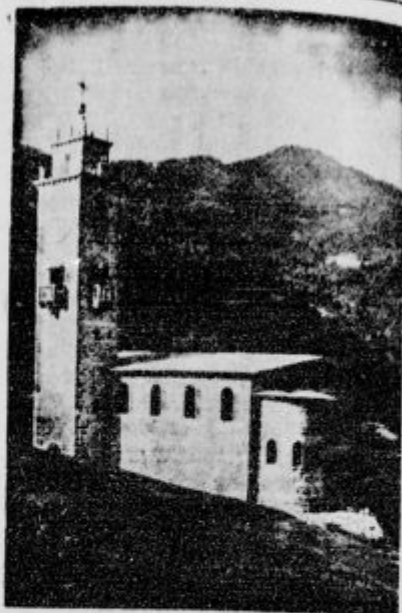
V Gornji Rečici nad Laškim so v pretečenih dneh dokončali zidarska dela pri novi cerkvi sv. Antona. Cerkev je 18 m dolga, 11 m široka in 9 m visoka. Zvonik ima do krita 26 m višine.

s Ubit, ko je hotel ubežati. Policija v romunski Bukarešti je izdala uradno poročilo, da je bil voditelj razpuščene »Železne garde« Codreanu ubit. Hotel je namreč pobegniti iz ječe, pa so ga pri poskusu straže pozvale, naj stoji. Codreanu se na pozive straže ni oziral, nakar je morala straža po predpisih streljati. Pri prvem strelu je Codreanu padel. Bil je takoj mrtev. Vest o žalostni usodi nekdanjega voditelja »Železne garde« se je z bliskovito naglico raznesla po prestolnici in izzvala javna razmotrivanja na ulicah. Ponekod