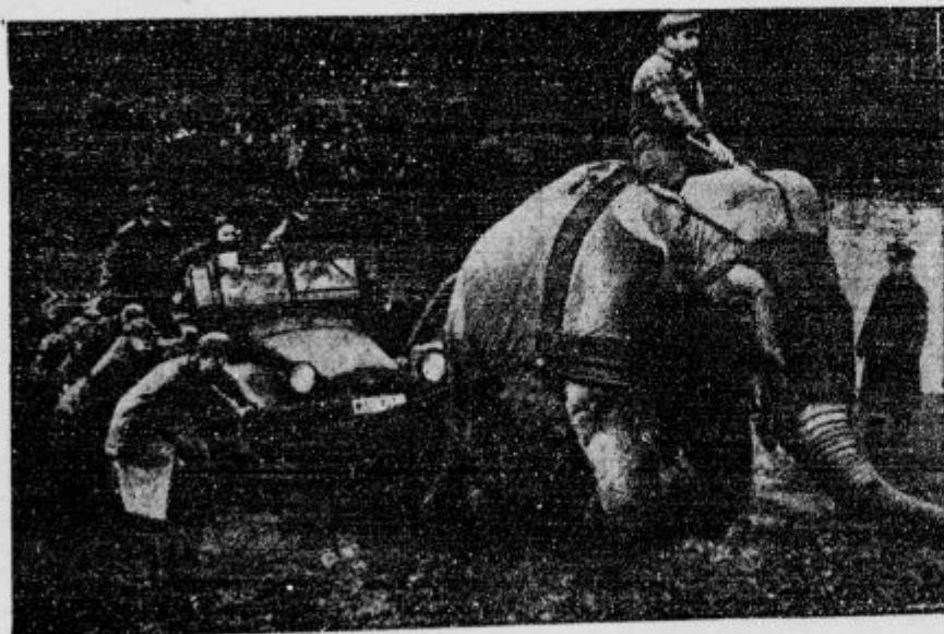
Sloni v moderni vojski

Po pisanju japonskega lista »Kokomin Simbun« je japonska vlada izdelala v sedmih točkah svoj načrt za politiko na Kitajskem: 1. Vse pogodbe in sporazumi političnega značaja, vstevši tudi pakt 9 sil, se morajo odpovedati ali pa spremeniti. 2. Vse ustanove, splošne koristi mora Kitajska voditi neodvisno, ter mora nadzorovati tudi svojo zunanjo trgovino. 3. Tuje velesile morajo priznati japonsko prvenstvo v kitajski obrambi, kakor tudi v politični in gospodarski upravi. 4. Gospodarska delavnost prebivalstva Kitajske, kakor tudi pripadnost drugih narodnosti, mora biti omejena v okviru kitajske samostojnosti. 5. Sodelovanje Japonske in Kitajske pri narodni obrambi ter politični in gospodarski upravi mora biti mnogo širše, kakor sodelovanje tujih držav. 6. Druge velesile se ne smejo vmešavati v razvoj kitajskega gospodarstva, zlasti pa v tistih podjetjih, ki so potrebna za obrambo vzhodne Azije. Ne smejo vstopiti tudi ne v uprave industrijskih podjetij, katerih delo je namenjeno vojaškim potrebam, kakor so n. pr. železnice, pristanišča, pomorski promet, letalska in vojna industrija. 7. Japonska bo podpirala in vodila kitajsko gospodarsko delavnost zaradi skupe obrambe vzhodne Azije.