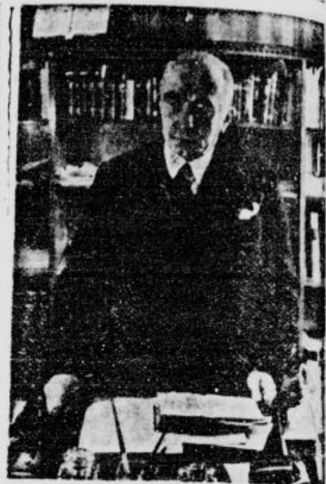
Dr. Emil Hacha — novi predsednik češkoslovaške države.

p Tako Čehi, kako pa naša gobezdala? Ob priliki jugoslovanskega državnega praznika piše češki časopis »Našinec« tole: »Jugoslavija je bila prva država iz vrste Male zveze, ki je našla pravo pot v zunanji politični usmeritvi. Je to pot male države med dvema močnima sosedoma. Treba se je z njima sporazumeti, kar je dokazala Jugoslavija. Nima na sreča veliko tujejezičnih manjšin, ki so državi samo breme. V odnosu do nas se Jugoslavija ni spremenila. Dogovor z Jugoslavijo v Mali zvezi, ki jo veže v primeru, da katero izmed teh treh držav napade Madžarska, je dal Jugoslaviji priliko dvakrat obnem z Romunijo uspešno nastopiti v Budimpešti. Ko pa se pri nas uredi razmere, se bodo — tako upamo — tudi naši gospodarski