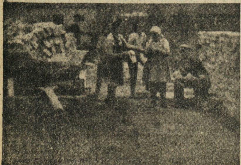
Priprava opeke za gradnjo

gradi uprava zasavskih premogovnikov, sami delavci in žene pristopili na pomoč in s prostovoljnim delom pomagajo, da gradnja uspešno napreduje. Do sedaj so že izvršili preko 4.000 prostovoljnih ur. Nujno je, da se v Trbovljah pristopi k pravilni organizaciji brigad in čet, da ima vsaka četa odgovorne vodje in kar je tudi važno statističarja. Vse premalo vodijo evidenco o doseženem delu, saj je dosti prostovoljnega dela napravljenega na raznih drugih sektorjih dela. Ker pa ni pravilne evidencije se ne more pristopiti k proglasitvi najboljših prostovoljcev in dajanju priznanja v obliki bronaste, srebrne, zlate in zlate značke na rdečem polju. Samo Ljubljana je na zadnji proglasitvi najboljših prostovoljnih delavcev imela 5126 značkarjev. Tudi Trbovlje bi jih že lahko imelo vsaj 100, ker pa ne vodijo statistike, to ni mogoče izvršiti. Nujno je, da se napravi temeljita reorganizacija in postavi štab delovnih brigad in čet, ki bo naredil točen razpored dela in, ki bo imel nalogo pripraviti vse potrebno, v prvi vrsti orodje in kar je glavno, da se postavi ljudi, ki bodo imeli čut odgovornosti. Le tedaj bomo uspeli in tudi v tem pogledu dokazali, da nočemo biti med zadnjimi.