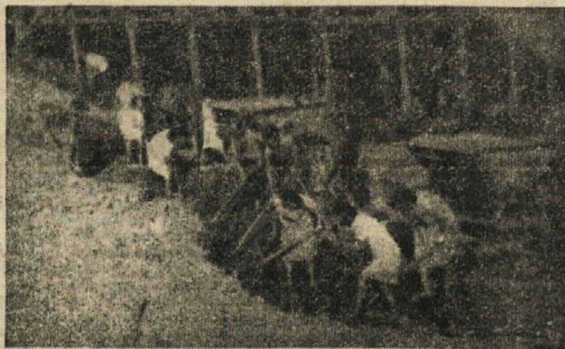
Uslužbenec federalnega zavoda pri delu za iskop Doma kulture in prosvete

v organizaciji prostovoljnega dela, ker k organizaciji niso znali pravilno pristopiti. Štab prostovoljnega dela je neelastičen, mrtev in samo, na papirju. Člani Frontovske organizacije so pripravljani za delo. Naj navedemo samo par slučajev: Ni pravilnega razporeda dela, statistike ne vodijo v redu. Uspehov najboljših prostovoljcev ne beležijo in prihaja do izraza samoiniciativa posameznikov. Tako so na primer v Trbovljah na Limbergu, kjer