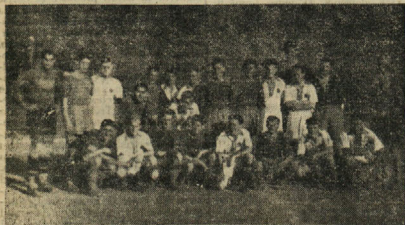
Moštvi: Kvarnerja Reka in Rudar pred pričetkom tekme

Fizikultura mora postati v novi Jugoslaviji last milijonov delavcev mest in vasi