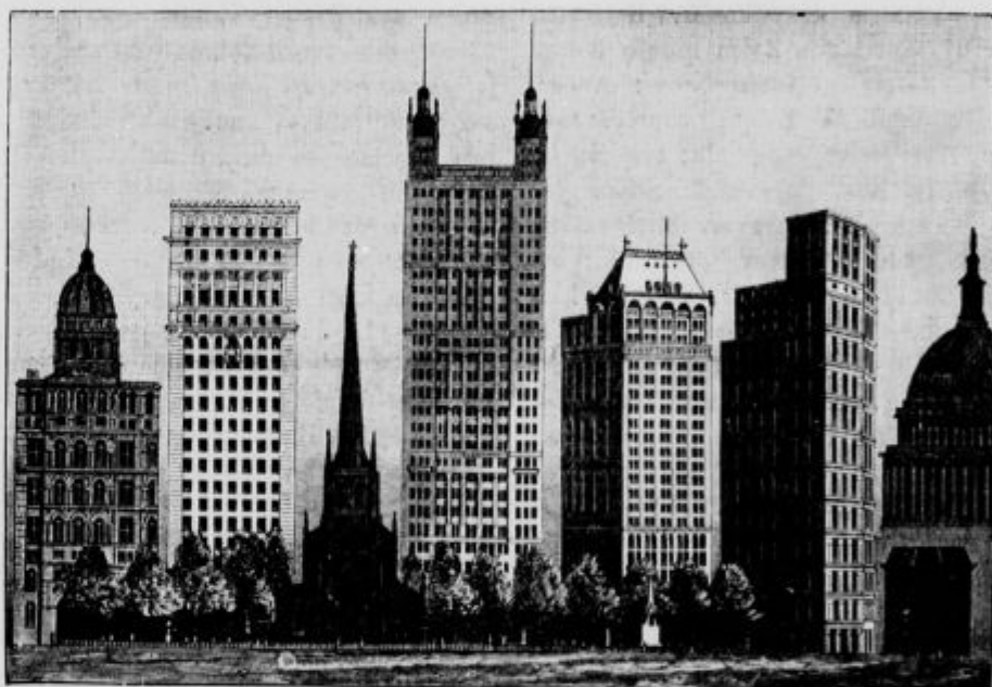
Časnik „World“, „Manhattan“, Cerkev presv. „Traktatska družba“ St. Pavel, Kapitol 89,4 m zavarovalnica, Trojice 87,5 m Park Row 88,2 m 93,4 m v Washingtonu, 94,9 m 117,4 m 87,4 m Časnik „Sun“, 21,3 m