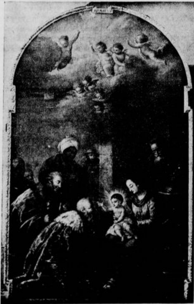
[ Sv. Trije kralji.

d Pismo polno zabavljanja poslal je Plantan mestnim očetom v Metliki o naših poslancih menda zato, ker je že on