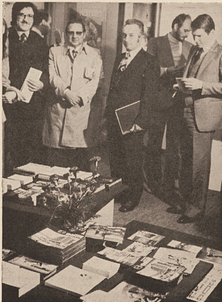
ISTIT je lani jeseni predstavil turističen prospekt južne Koroške v več jezikih.

Na klavzuri predstojništva so obravnavali tudi načelna izhodišča KEL, ki se bo še vnaprej v deželi zavzemala za narodnostne pravice slovenske narodne skupine, v ospredju politike pa bo politični boj za socialne težnje južnokoroškega prebivalstva ter tesno sodelovanje z nemškogovorečimi demokraciji.