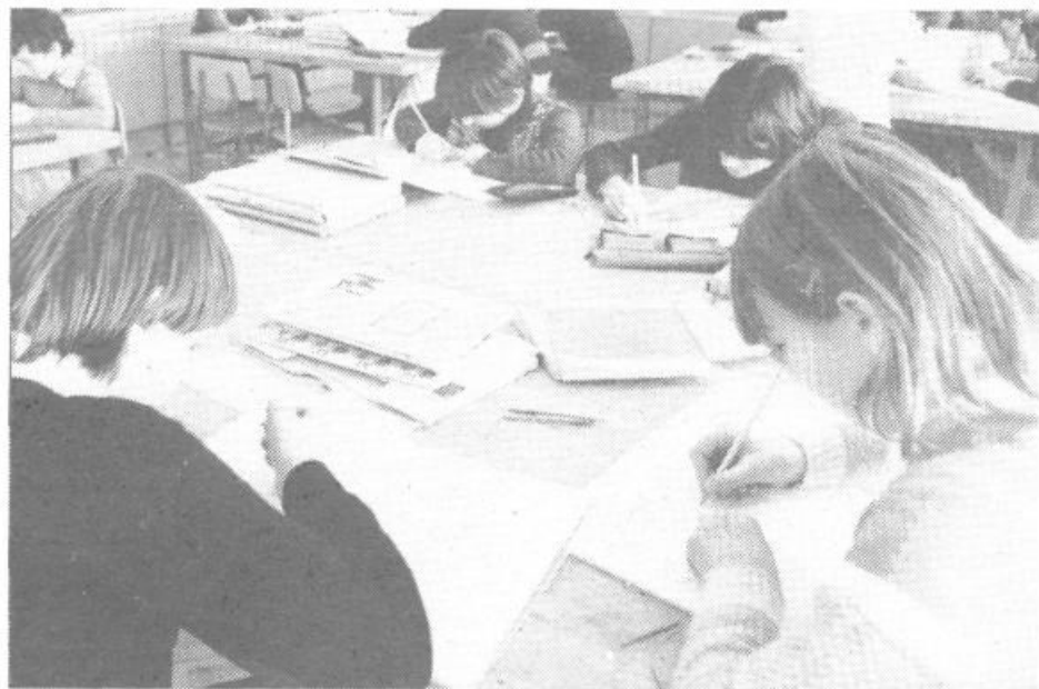
Učenci vse naloge opravijo v šoli in domov se napotijo brez torbic.