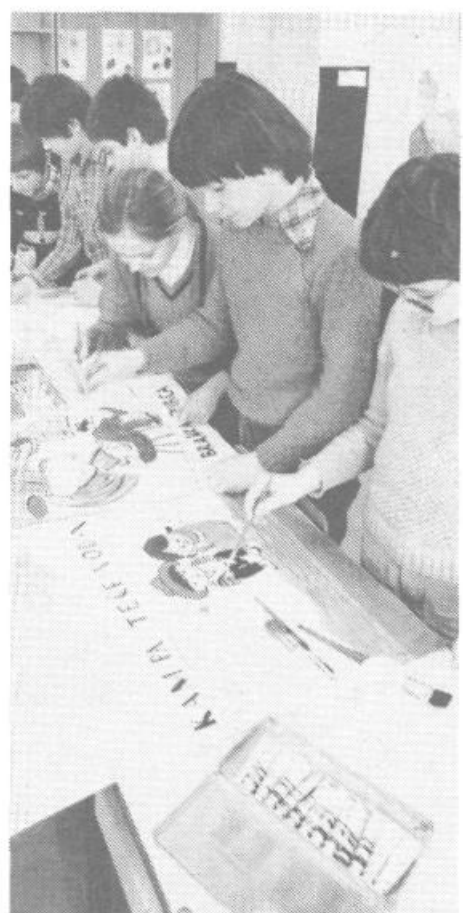
Na šoli imajo veliko izvenšolskih dejavnosti. Tako učenci lažje odkrivajo svoje sposobnosti.