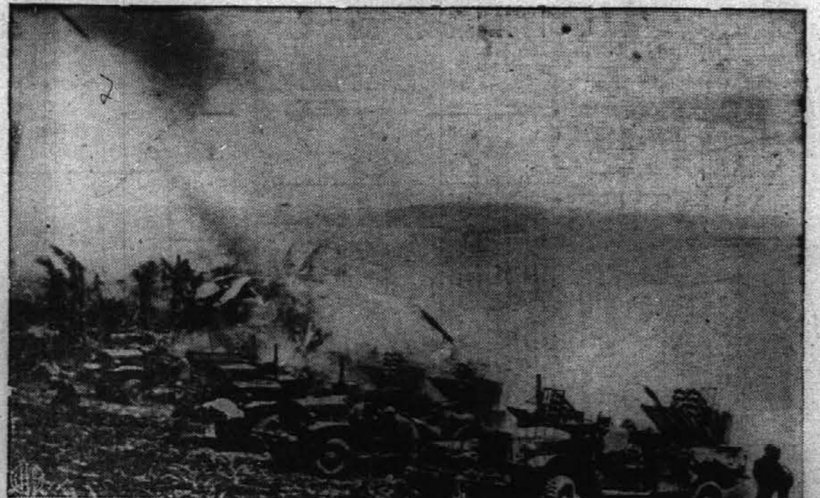
To je prva slika dovoljena za objavo, kako spuščajo majhne raketske bombe kar iz majhnih vojaških avtomobilčkov "jeeps", na katere pritrjujejo cele robotske skladalnice.