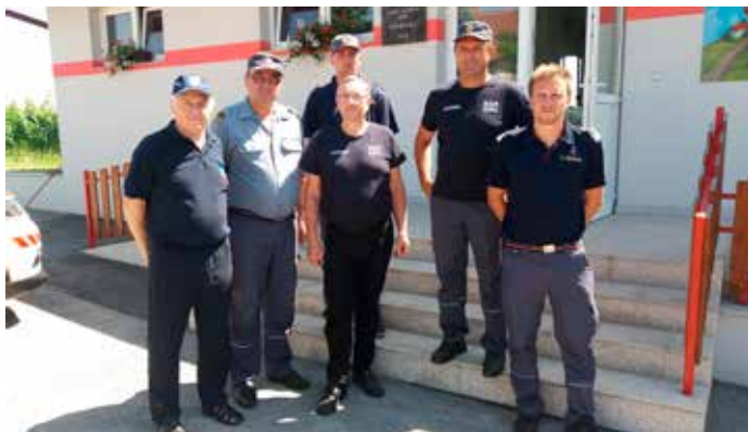
Komisija pred lanskim najlepše urejenim domom v Hermancih

Za najlepše vzdrževan gasilski dom v letu 2019 je proglašen gasilski dom Hardek, drugo mesto je bilo dodeljeno gasilskemu domu Vitan-Kog, tretje mesto pa prejel dom v Ivanjkovcih. Nagrade so bile podeljene na dnevu gasilcev v Ivanjkovcih.