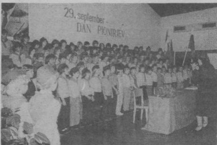
S pesmijo Mi smo slovenski pionirji se je 29. septembra ob dnevu slovenskih pionirjev pričela na osnovni šoli Leopolda Mačka-Boruta v Novem Polju, odkoder je tudi naš posnetek, mladinska delovna konferenca. Pionirji so ta dan pregledali svoje delo, hkrati pa so povedali, kako se bodo vključevali v samopravno oblikovanje dela in življenja na šoli. Podobno je bilo tudi na vseh drugih osnovnih šolah v naši občini.