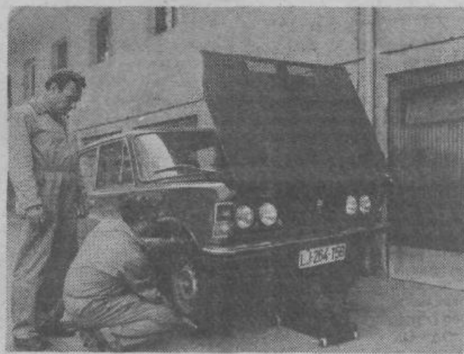
Mehaniki pregledujejo vozilo pred delavnicami AMD Moste na Kodeljevem.